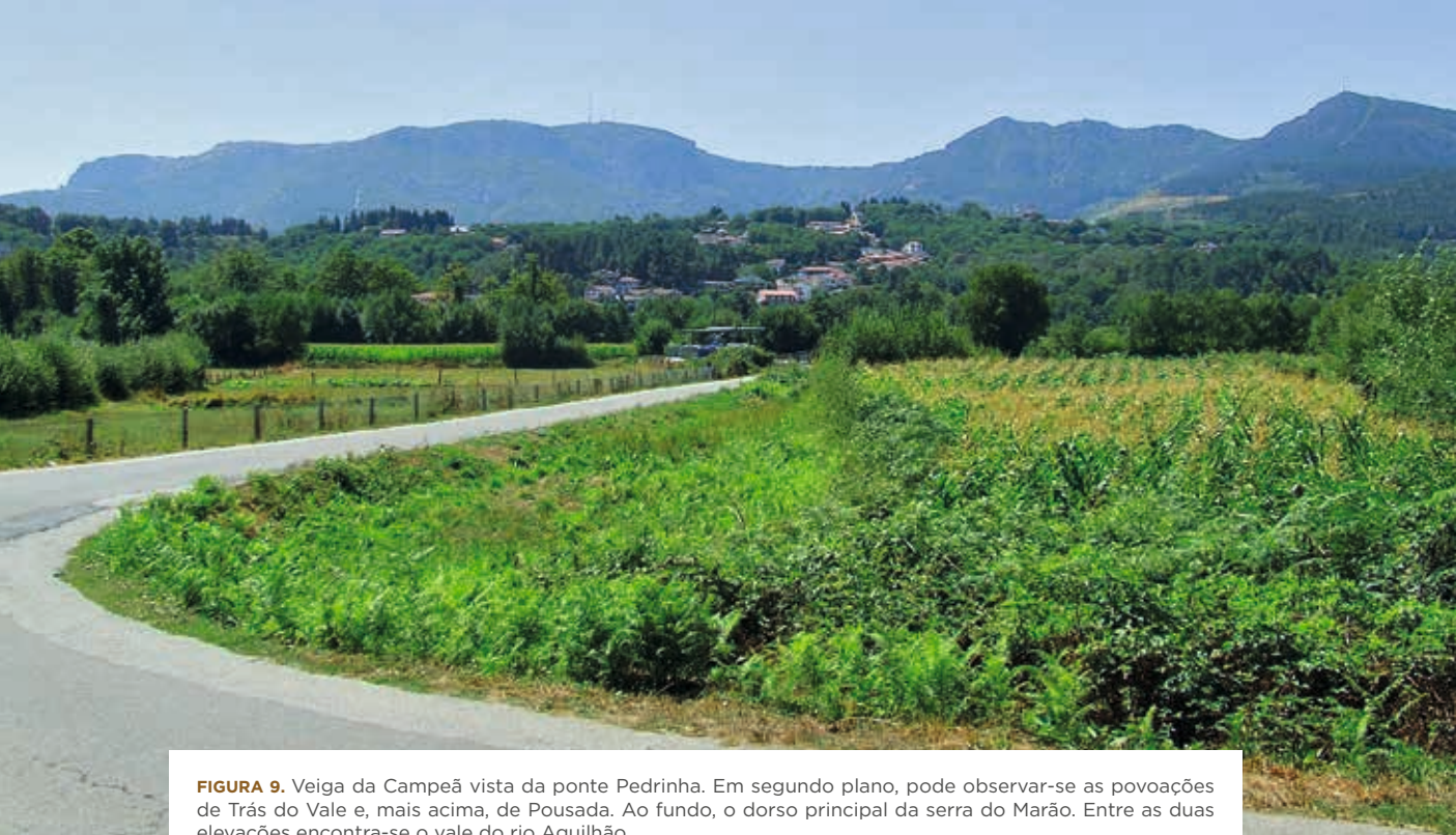
FIGURA 9. Veiga da Campeã vista da ponte Pedrinha. Em segundo plano, pode observar-se as povoações de Trás do Vale e, mais acima, de Pousada. Ao fundo, o dorso principal da serra do Marão. Entre as duas elevações encontra-se o vale do rio Aguihão.

vizinha terra de Penaguião. Possivelmente, essa ligação far-se-ia através dos lugares de Parada, Farelães, Porto d’Olmo, Fajo, Fonte Concieiro, Corvo, Arcadela, Fiolhais, Parada do Monte e Viso, continuando depois em direção ao rio Douro, pelo vale do rio Sermanha, seguindo a via romana anteriormente descrita. O Viso fica na linha de cumeada da elevação que separa o vale do rio Aguihão do princípio do vale do rio Sermanha. Esta elevação constituía, em 1134, o limite sul do couto da Albergaria do Marão e, ao mesmo tempo, a divisória entre as terras de Panoias e de Penaguião – “(...) quomodo divit cum Pena Guiam (...)” (Costa, 1965-1990). Este caminho terá sido aquele que percorreu D. Dinis quando da sua primeira visita, como rei de Portugal, a Trás-os-Montes, em agosto de 1280. Pois, no dia 8 encontrava-se em Lamego, no dia 10 na Campeã e no dia 16 em Constantim (Franco, 1955, p. 89; Coelho, 2004, p. 434).