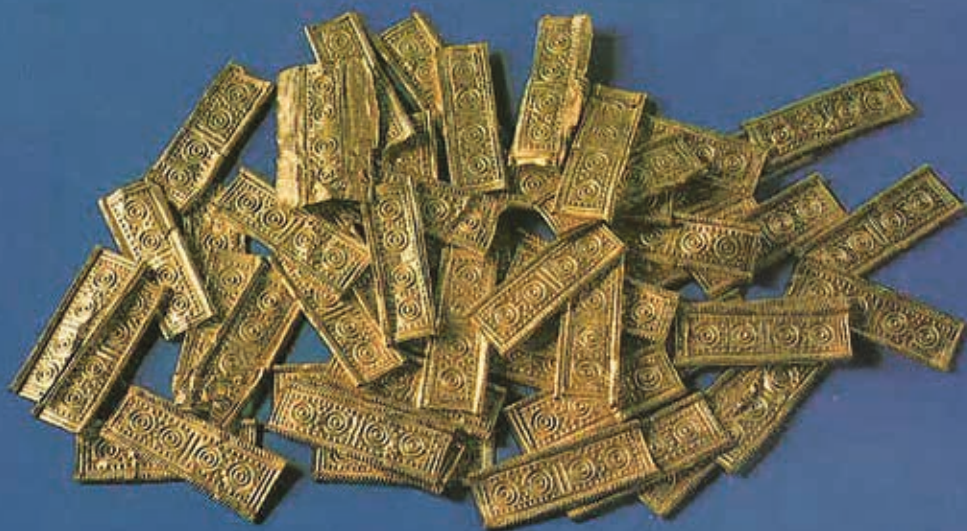
FIGURA 2. Colar da Malhada, atualmente no Museu Nacional de Arqueologia. Seria constituído por 56 placas organizadas em coroa circular, cosidas sobre tecido ou couro (Museu Nacional de Arqueologia).

romano-medieval (Lopes, 1998). A presença destes monumentos testemunha a tendência que os povos da época dolménica tinham para edificar as suas sepulturas junto dos grandes itinerários naturais (Almeida, 1968).