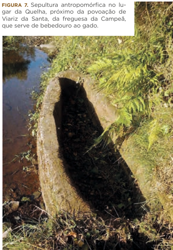
FIGURA 7. Sepultura antropomórfica no lugar da Quelha, próximo da povoação de Viariz da Santa, da freguesia da Campeã, que serve de bebedouro ao gado.

Conclui-se esta pequena descrição dos vestígios de tumulação associados à Via do Marão com uma sepultura de granito que se encontra num caminho conhecido por Quelha, situado entre as povoações de Viariz da Santa e Pousada. Trata-se de um sarcófago antropomórfico de granito, situado junto de uma nascente de água e que serve de bebedouro ao gado. A largura varia entre 90 cm e 50 cm, o comprimento é de 2,2 m e a altura é de 43 cm. Possui um orifício lateral junto à extremidade mais estreita. A sua localização deverá estar próxima da original, dado que o topónimo Quelha está, normalmente, associado a caminhos antigos. Por aqui passaria uma derivação da Via do Marão, que se separava da principal no lugar da Veiga das Latas e continuava por Viariz da Santa, Quelha, Pousada e Boavista, descendo depois para o vale do rio Aguilhão.