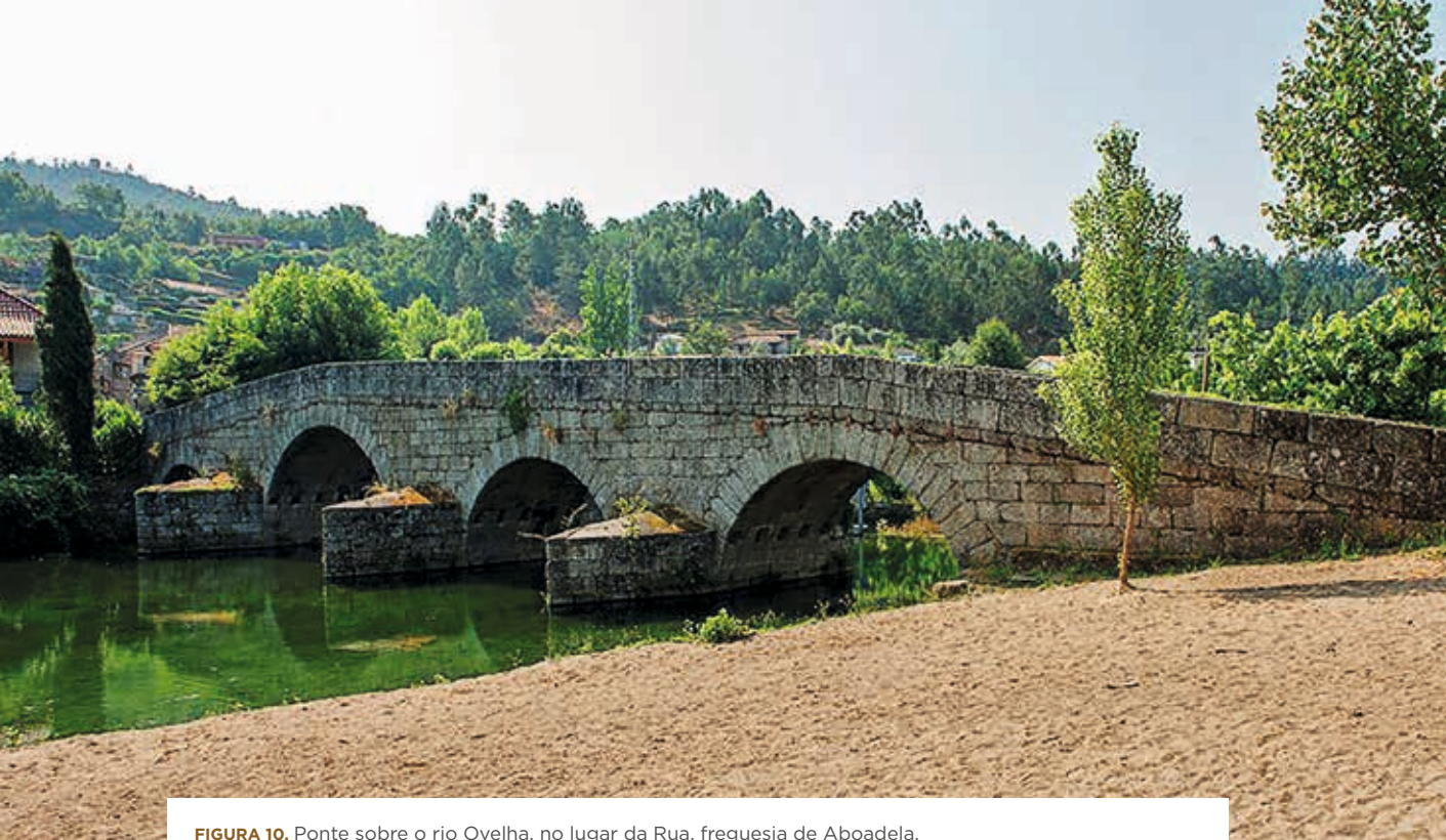
FIGURA 10. Ponte sobre o rio Ovelha, no lugar da Rua, freguesia de Aboadela.

sável pela execução da ponte de Larim, também sobre o rio Ovelha, nas proximidades de Gondar, que está inserida sobre uma derivação da via proveniente de Amarante e se dirige para a região do Douro, através de Mesão Frio (Viterbo, 1988, p. 75). A ponte sobre o rio Corgo foi também objeto de importante remodelação durante a dinastia filipina (Serenó, Dordio e Noé, 2004).