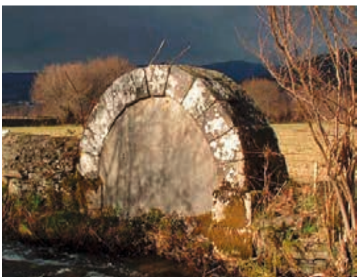
FIGURA 4. Arco junto à calçada de Chão-Grande. Os proprietários do terreno taparam um dos lados com uma parede em tijolo, para fazerem um abrigo. Este monumento merecia ser devidamente classificado e preservado, de acordo com a sua importância patrimonial.

tes, escrita em 1549, refere a sua existência e avança com as seguintes explicações sobre a sua origem: “São sepulturas de Tiranos grandes, que se levantarão em outro tempo com aquela terra e não davam obediência a El Rey de Espanha. Outros dizem que são de homens que morrerão em desafio, e que por serem nobres lhes fizeram aquela memória seus parentes, porque não podiam por direito haver Eclesiástica Sepultura” (Barros, 1919, p. 110).