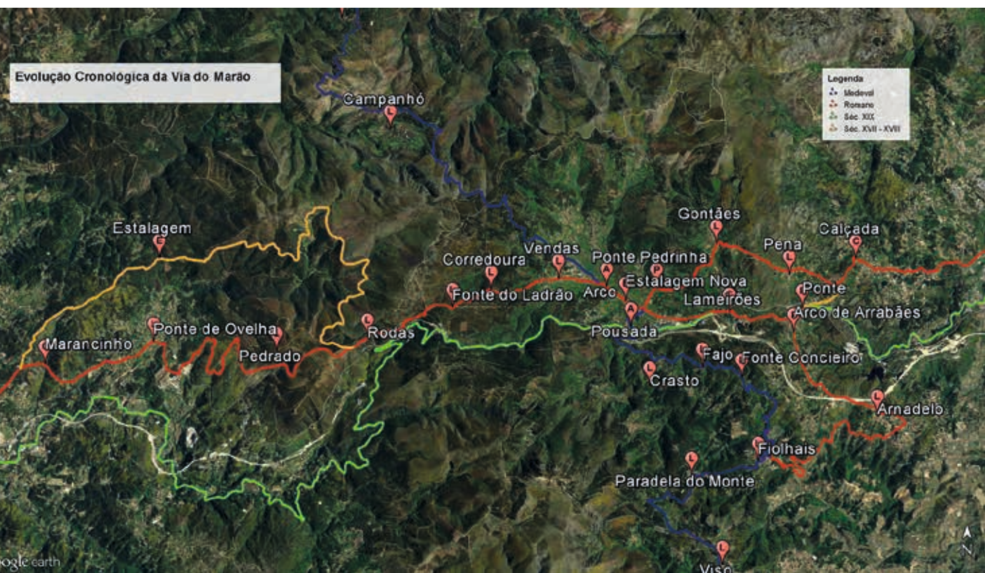
FIGURA 12. Representação sobre fotografia aérea dos troços da Via do Marão correspondentes a diferentes épocas. A vermelho, os troços de origem romana; a azul, os troços de origem medieval; a amarelo, os troços do século XVII-XVIII; a verde, os troços do século XIX.