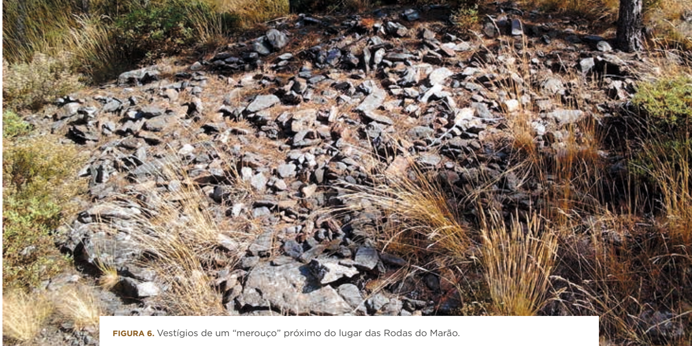
FIGURA 6. Vestígios de um “merouço” próximo do lugar das Rodas do Marão.

Outros vestígios funerários que é possível encontrar junto do antigo caminho do Marão são amontoados de pedras, localmente conhecidos como “morouços” ou “merouços”. João de Barros escreve: “Outro modo de Sepulturas há na terra do Marão que são grandes montes de pedras miúdas, e há fama que jazem ali grandes ladrões, que naquela Serra andavam (...)” (Barros, 1919, p. 110). Viterbo designa esses amontoados de pedras por “fiéis de deus” (Viterbo, 1865, p. 326). José Leite de Vasconcelos diz também que “no Marão, junto à antiga estrada de Vila Real para Amarante, (...); há muitas cruzes que indicam mortes; junto das cruzes cada viandante reza um Padre-Nosso e deita uma pedrinha”. Acrescenta, ainda, que ninguém deve tocar nos montículos de pedra (Vasconcelos, 1882, p. 129). Alguns desses amontoados de pedras podem ser observados atualmente ao longo do antigo caminho do Marão, entre a Fonte do Ladrão e o Pedrado.