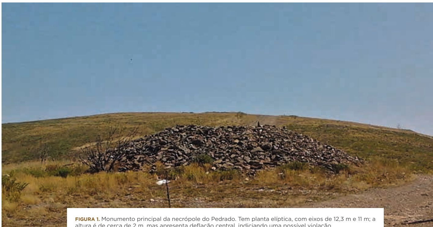
FIGURA 1. Monumento principal da necrópole do Pedrado. Tem planta elíptica, com eixos de 12,3 m e 11 m; a altura é de cerca de 2 m, mas apresenta deflação central, indiciando uma possível violação.

natural entre o litoral e o interior do Norte do País. Nos primeiros reinados da nacionalidade, este obstáculo geográfico era de tal forma marcante que a província situada a nascente destas serranias foi designada de “Trás-los-montes”.