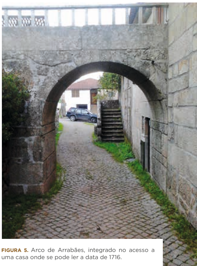
FIGURA 5. Arco de Arrabães, integrado no acesso a uma casa onde se pode ler a data de 1716.

A lenda da princesa Ximena, associada à origem da linhagem dos Telo de Meneses, poderá estar ancorada na memória da passagem de Ordonho II pela Via do Marão, quando da sua deslocação a Aliobrio . Efetivamente, no dia 28 de setembro de 911 houve uma grande assembleia em Aliobrio , presidida por Ordonho II, que juntou as principais autoridades civis e religiosas galegas (Herculano, 1856-1973).