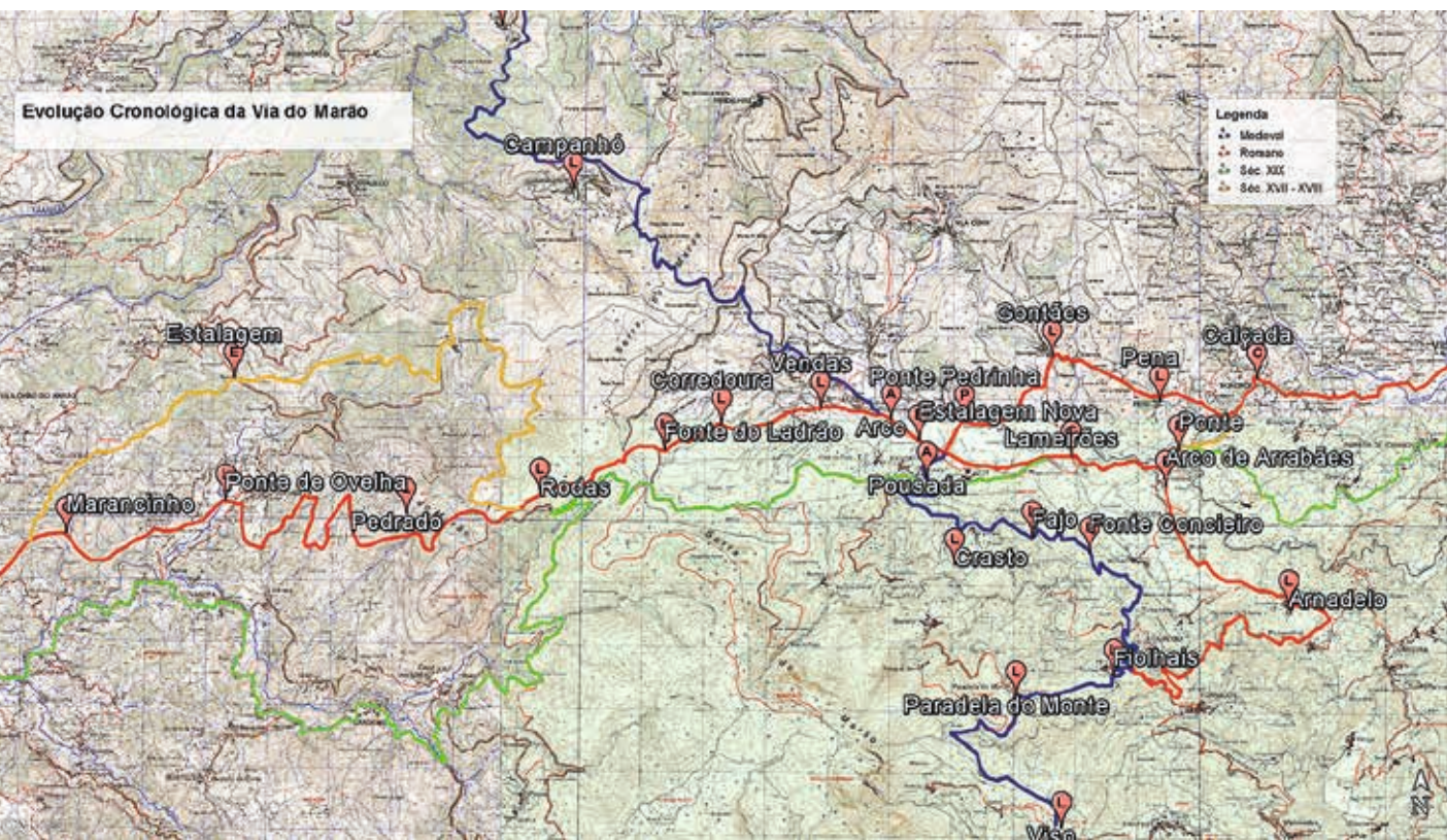
FIGURA 11. Representação sobre a Carta Militar de Portugal , folhas 101, 102, 114 e 115, dos troços da Via do Marão correspondentes a diferentes épocas. A vermelho, os troços de origem romana; a azul, os troços de origem medieval; a amarelo, os troços do século XVII-XVIII; a verde, os troços do século XIX.