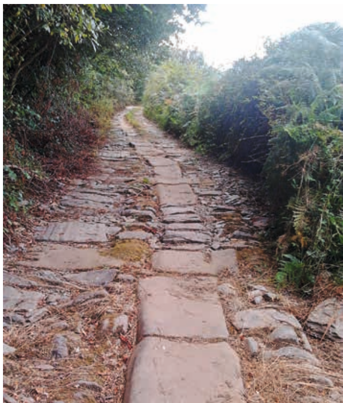
FIGURA 3. Calçada próxima da povoação de Chão-Grande, freguesia da Campeã. Nos meses de inverno, este caminho serve de leito ao ribeiro dos Azibais.

gar houve um castro que, de acordo com os vestígios de tégula que aí foram encontrados, terá sido romanizado. A partir do Crasto poderiam seguir ligações aos castros de Arnadelo e de Fontes, situados a jusante, no mesmo vale.