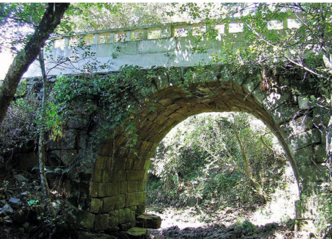
FIGURA 8. Ponte Pedrinha sobre o rio Sôrdo, próxima da povoação de Quintã. São evidentes os sinais de instabilidade do arco, que necessita urgentemente de obras de consolidação e restauro.

A designação ponte Pedrinha poderá derivar de uma tradição semelhante à dos “Fieis de Deus”, pois a tradição popular diz que aí pereceram pessoas ao atravessar a ponte em tempo de cheias, por esta não ter parapeitos. Contudo, Viterbo propõe a seguinte explicação: “Depois de expulsos os Mouros, chamaram os Portugueses Pontes Pedrinhas às que eram de pedra, e muitas conservam ainda o distintivo de pedrinhas, sendo mui ordinário o fazerem-nas de pau” (Viterbo, 1865, p. 48).