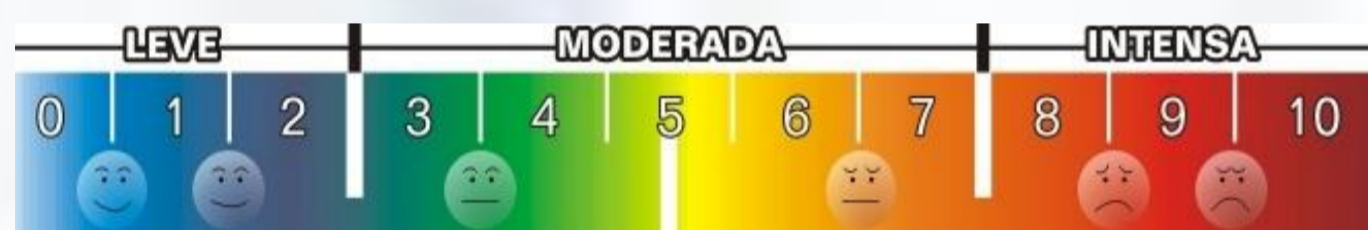
Fig. 1 – Escala Analógica Visual - EVA

A OMS estima que cerca de 30% da população mundial apresenta dor crónica. A DGS refere a “Dor como 5º Sinal Vital”, pelo que o seu controlo é um direito dos doentes e um dever dos profissionais de saúde. Sendo de boa prática o seu registo sistémico, através do Instrumento de Auto-avaliação de Dor - Escala Visual Analógica (EVA).