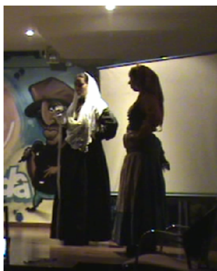
Trajes Tradicionais Portugueses