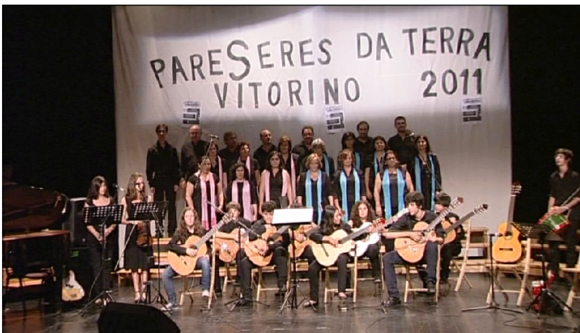
Coro de Pais do CVS