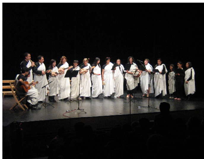
Tuna do lençol Agrupamento de Escolas Dr. Manuel Pinto de Vasconcelos – Freamunde