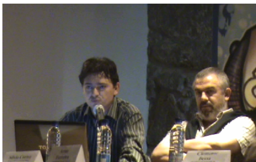
Conferência Música Tradicional Portuguesa