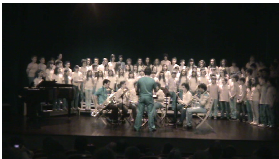
Orquestra de Sopros