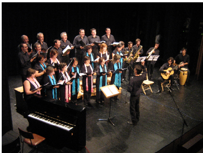
Coro de Pais do CVS