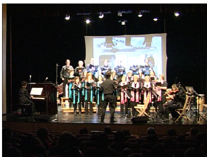
Coro de Pais CVS