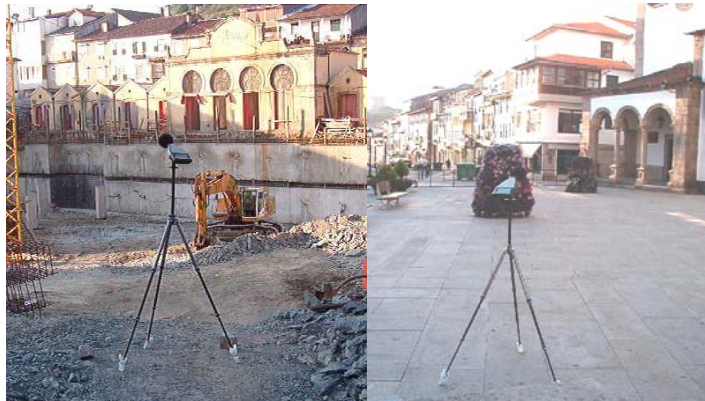
Figura 6 - Monitorização do ruído ambiente na Obra do Parque de Estacionamento Subterrâneo da Praça Camões, Bragança.

De modo a avaliar quantitativamente o impacte da obra sobre o ambiente sonoro da zona de implementação e sua envolvente, seleccionou-se um conjunto de locais de medição, distribuídos pelo espaço interno e externo à vedação que a delimita, onde se efectuaram medições de ruído, avaliando situações de actividade e inactividade, diferentes períodos do dia e diferentes etapas do projecto (Figura 6).