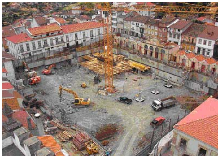
Figura 1 - Fim da fase de escavação e arranque da construção da estrutura do Parque Subterrâneo