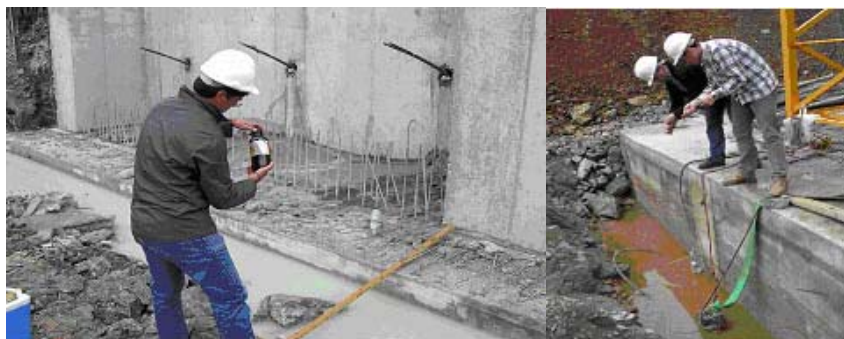
Figura 4 – Recolha de efluentes de obra

A escolha destes parâmetros foi motivada pelo potencial de afectação da qualidade do efluente pelas actividades desenvolvidas no local, em particular: pelo incremento dos teores de sólidos suspensos; pela alcalinização pelos elementos calcários do cimento; pela presença de hidrocarbonetos, óleos e gorduras, resultantes de derrames de lubrificantes e combustível; e ainda, pela possível existência de metais pesados. A possível ruptura de condutas de saneamento, motivou a avaliação dos teores de CBO 5 , CQO e OD.