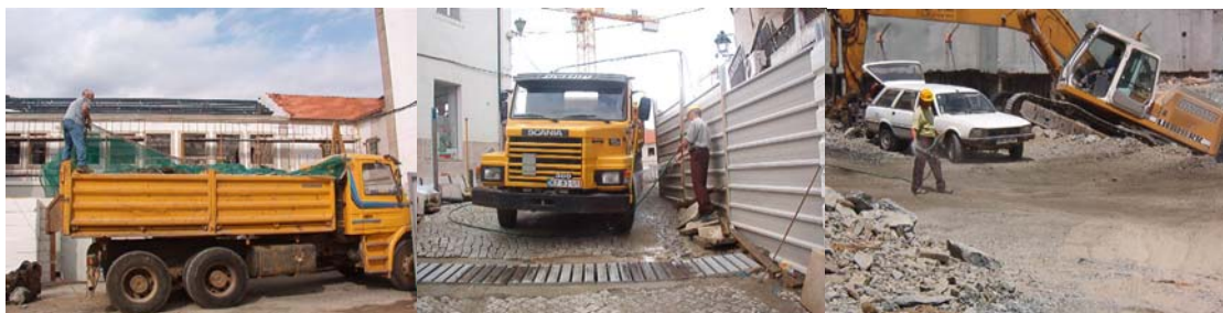
Figura 5: Lavagem dos Rodados, humedecimento da superfície da obra e cobertura das cargas.

Os resultados desta acção de monitorização apontam no sentido da variação dos teores de matéria particulada em função da ocorrência de actividades mais poluentes, verificando-se teores particularmente significativos nos teores de PM 10 .