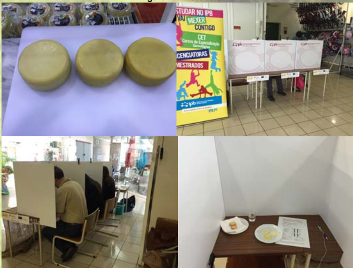
Figura 1 – Materiais

As três amostras de queijo foram apresentadas aos consumidores num prato plástico de sobremesa, estando o código do queijo inscrito no prato ao lado da fatia de queijo. Cada fatia tinha cerca de 4 milímetros de espessura. Foi, também, fornecido um prato contendo três tostas, um guardanapo e um copo de água. Os consumidores foram informados de que deveriam limpar o palato entre a degustação de cada uma das três fatias de queijo uma vez que as fatias eram fornecidas ao mesmo tempo. Para limpar o palato, os consumidores poderiam recorrer à água e/ou às tostas (Figura 1).