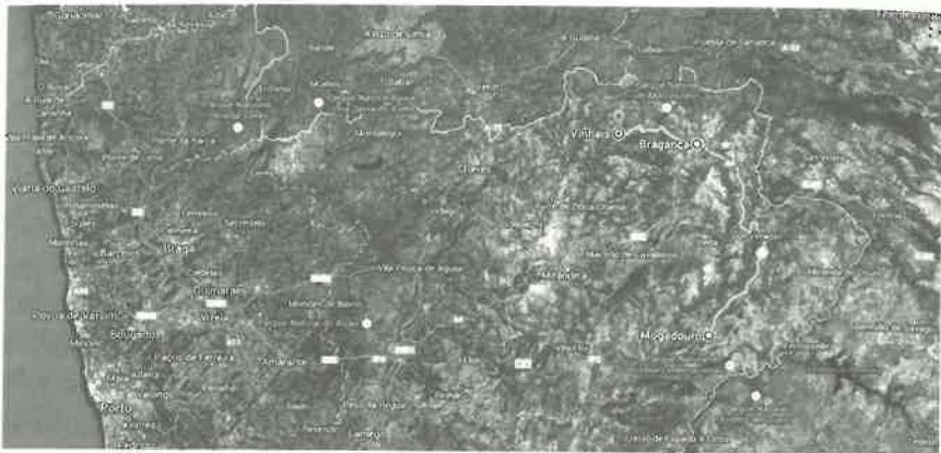
1. imagem de satélite do norte do território de Portugal com demarcação da rota que une Bragança, Mogadouro e Vinhais, contigua à linha de fronteira que separa do território espanhol.

longo da história de arte, um valor catequético que ultrapassa ou é concorrente com o seu valor estético. Neste sentido, a imagem sublima o conceito que se pretende transmitir, orientando a nossa interpretação da escultura sacra como projeção simbólica do ideal moral, individual e social, preconizado pela igreja católica.