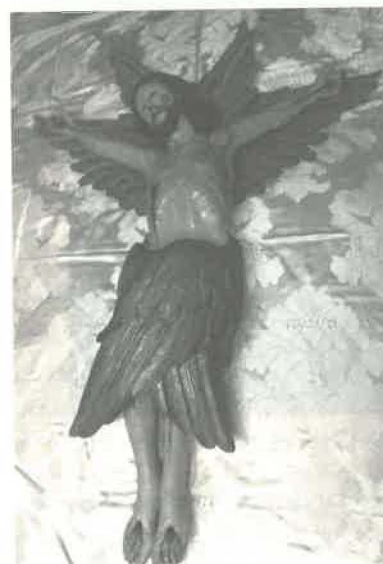
5. Cristo Serafim – Cristo na visão de São Francisco no Monte Alverne, Século XVIII(?).