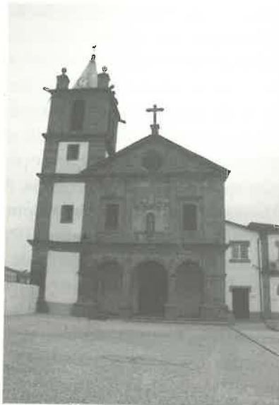
9. Vista da fachada da igreja de São Francisco – Mogadouro. Século xvii (1667\1689)

A imagem de Nossa Senhora das Graças, atualmente padroeira da cidade de Bragança, foi adquirida em 1862, segundo Francisco Felgueiras no seu texto “Roteiro e escorço histórico da cidade de Bragança”, publicado na revista Amigos de Bragança de 1964 e citado por Jacob (Jacob, 1997).