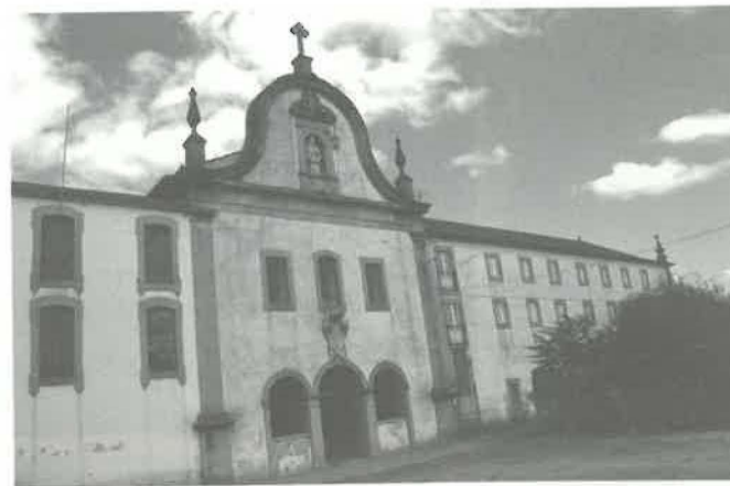
11. Fachada da igreja de Nossa senhora da Encarnação – Seminário Apostólico século XVIII.