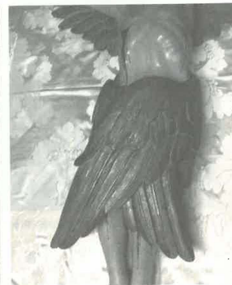
6. Detalhe da escultura de Cristo Serafim – Cristo na visão de São Francisco no Monte Alverne, Século XVIII(?).