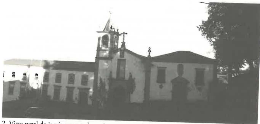
2. Vista geral da igreja e parte do antigo convento de São Francisco em Bragança.

Em 1721-1724, Cardoso Borges escrevia que “o primeiro convento que a religião seráfica teve em Portugal é o desta cidade nasceu nas mãos do Santo Patriarca, no de 1214, na ocasião que, voltando da romaria de Santiago, passou por esta cidade e a honrou com a sua presença. (...) A tradição nesta cidade e suas vizinhanças é tão constante que ninguém se atreveria a dizer o contrário sem nota de temeridade.” (Borges, 2012, p. 142)