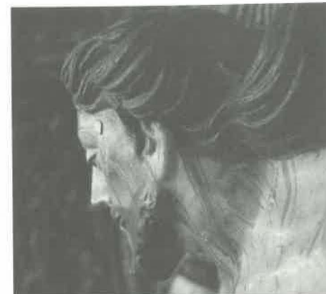
4. Detalhe da escultura de Cristo na Cruz com braço direito pendente, evocando o abraço místico a São Francisco, século XVIII(?).