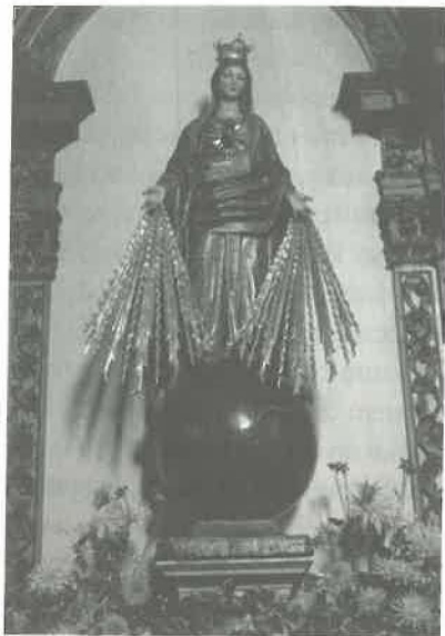
8. Imagem de Nossa Senhora das Graças