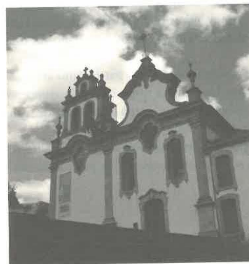
14. Fachada da igreja de São Francisco – da Venerável Ordem Terceira da Penitência.

Das 13 esculturas hoje expostas a culto no interior da igreja destacam-se, pela sua raridade, dois conjuntos escultóricos em cerâmica colocados dentro de caixas envidraçadas e designados de maquinetas (figura 15). Estão colocados, um de cada lado do templo, junto ao arco de triunfo e o que está no lado do evangelho representa um presépio, enquanto o que está colocado no lado da epístola representa uma descida da cruz.