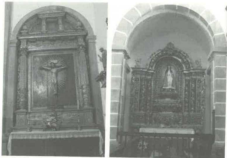
9. Retábulo em talha barroca nacional da Senhora do Caminho (primeira capela do lado do Epístola). 10. Retábulo maneirista com escultura de Cristo Crucificado. Transepto do lado do Epístola