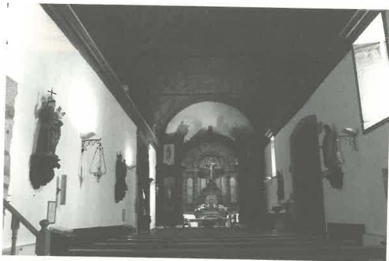
7. Vista geral do interior da igreja de Santa Clara.

A 8 de dezembro de 1569, o bispo de Miranda, D. António Pinheiro, benzeu solenemente o sítio para o convento de freiras de Santa Clara, debaixo do título de Nossa Senhora da Conceição (Alves, 2000).