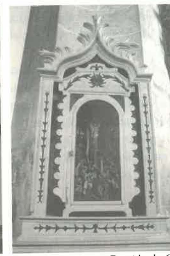
15. Maquineta com Descida da Cruz – finais do século XVIII(?)