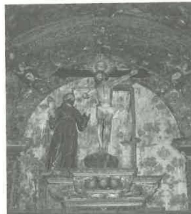
3. Retábulo em talha barroca, do lado do Epístola. Cristo na Cruz com braço direito pendente evocando o abraço místico a São Francisco, século XVIII(?).

O outro conjunto (Cristo Serafim e São Francisco ajoelhado) está atualmente guardado, pois a interrupção das obras de restauro do retábulo do altar – mor provocou a alteração na disposição de algumas imagens que carecem ainda de suporte,