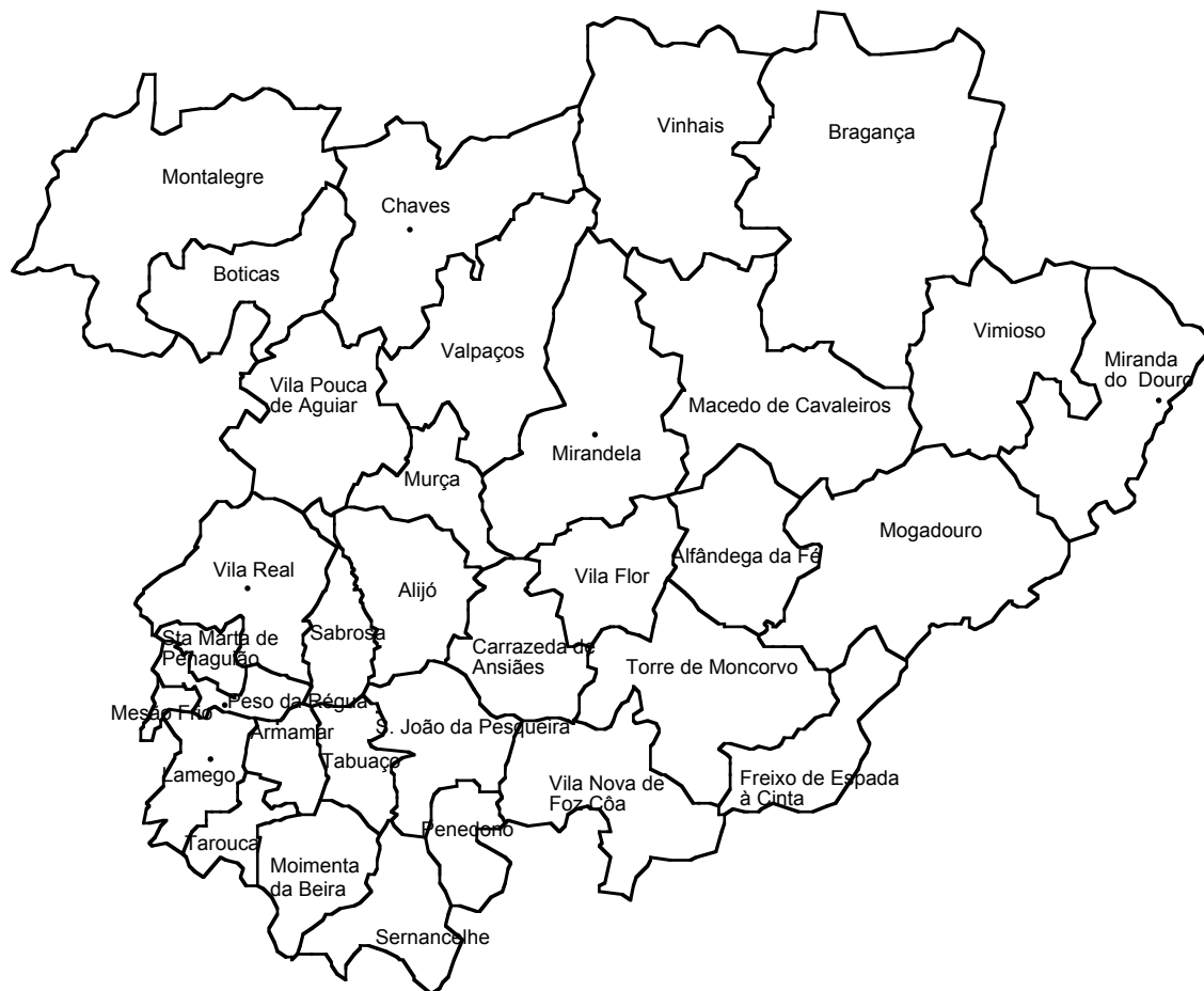
Fig.1- Área geográfica das regiões de Alto Trás-os-Montes e Douro

Na generalidade das explorações que se dedicam a esta actividade no interior Norte do país, a criação de ovinos é feita segundo modelos de sistemas de exploração extensivos.