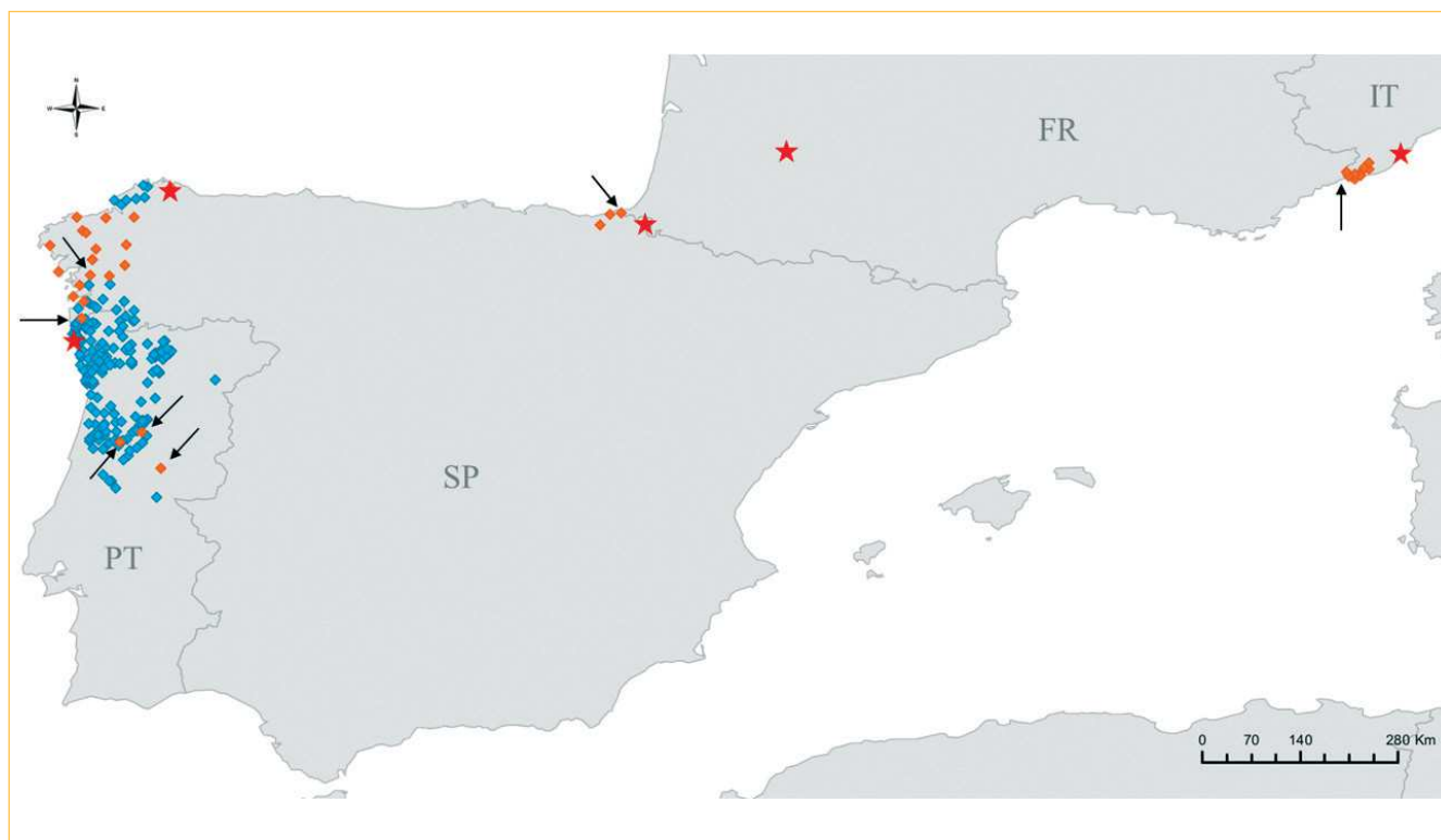
Fig. 1: Distribuição geográfica dos indivíduos amostrados em Espanha, Portugal e Itália. Os pontos cor de laranja correspondem aos indivíduos geneticamente mais próximos da população francesa enquanto os pontos azuis correspondem aos indivíduos mais próximos da população portuguesa, com base nos dados dos microssatélites (marcadores do DNA nuclear). As setas indicam os indivíduos identificados como migrantes de primeira geração na análise genética. As estrelas vermelhas indicam o local onde o primeiro indivíduo foi avistado em cada país.

conhecido na gíria da genética populacional como efeito fundador). A perda de diversidade genética pode ser mais ou menos acentuada, o que depende por um lado do tamanho do propágulo (apenas uma fêmea fecundada por 3-5 machos, no caso da introdução da vespa asiática em França, e número desconhecido em Portugal) e por outro da existência de um fluxo contínuo de migrantes a alimentar a frente invasora (Swaevers et al. 2013). Como se pode ver na Fig. 2, o impacto do efeito fundador na diversidade genética da população francesa não foi muito acentuado. O propágulo introduzido em França conseguiu reter 85,2% da riqueza alélica (medida de diversidade genética calculada pelo número de alelos existente numa população, e que determina o seu potencial de adaptação a longo termo) e 79,9% da heterozigotia (medida de diversidade genética dependente da presença de dois alelos diferentes num indivíduo diploide) presentes na população parental Chinesa de Zhejiang/Jiangsu (Arca et al. 2015). Este grau de perda de diversidade genética (14,8% e 20,1%, Fig. 2) é da ordem de grandeza do que vem sendo reportado para outros invasores (animais e plantas) e está relacionado com o sucesso da invasão (revisito por Bossdorf et al. 2005; Dlugosch e Parker 2008; Roman e Darling 2007; Wares et al. 2005).