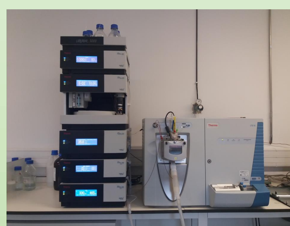
Fig. 1 HPLC-DAD-ESI/MS n usado na identificação e quantificação de compostos fenólicos

Os extratos de casca de marmelo foram preparados pelas técnicas de maceração dinâmica hidroetanólica e decocção. O rendimento de extração foi avaliado gravimetricamente e os compostos fenólicos detetados nos extratos foram caracterizados por HPLC-DAD-ESI/MS (Fig. 1); a atividade antioxidante foi avaliada in vitro pelos ensaios de inibição da formação de substâncias reativas aos ácido tiobarbitúrico (TBARS) e da hemólise oxidativa.