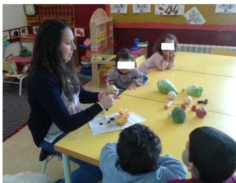
Figura 7 -Atividade prática “Fruta ou legume

Comecei por desafiar as crianças a descobrirem as características desses alimentos, colocando-lhes algumas questões a respeito da sua cor, tamanho e textura. As crianças revelaram facilidade em identificar e descrever essas características. Como defendem Hohmann e Weikart (2011),