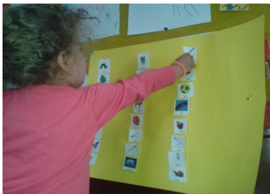
Figura 4 -Jogo de rimas

Quando as crianças estavam a trabalhar nas áreas da sala, repetimos o jogo das rimas, mas agora de forma individual. Assim, cada uma das crianças, foi à vez, ao placar resolver um dos casos apresentados na tabela. Voltei a explicar a cada uma das crianças, individualmente, em que consistia o jogo e pedi-lhe para soletrar a palavra, dividindo-a em sílabas, de modo a que lhe fosse mais fácil encontrar a sílaba tónica e ter a percepção clara da terminação da palavra, no sentido de lhe ser mais fácil associar as palavras que rimavam. Na figura 5 apresentamos a imagem relativa à atividade, no sentido de melhor se perceber como foi organizada.