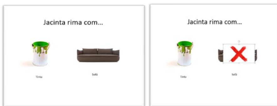
Figura 2 -Palavras e imagens apresentadas para identificar rimas

Conforme já referi, comecei por mostrar, através da projeção em PowerPoint, as imagens relativas às palavras (tinta, sofá, cama, lata, mala, menino, piscina, telefone, saca, rato, águia, berlinde, pau, mosca, juiz, Emanuel 12 , cartolina, afia, radio, menina, mesa, baleia, leopardo, jaula) de forma a que as crianças as identificassem, para assim poderem realizar as rimas. Depois de identificadas as imagens solicitei, uma criança de cada vez, a encontrar a rima correspondente ao nome que eu dizia. Ou seja, eu lia a palavra que estava escrita no diapositivo e pedia a uma das crianças que, com base nas imagens apresentadas, identificasse a palavra que rimava com aquela que acabara de ouvir. Em cada diapositivo estavam duas imagens apenas o nome de uma delas rimava com o nome que se referia a um dos familiares. Na figura 3 está exemplificado o procedimento aqui descrito. Após a criança dizer a palavra que rimava, levantava-se da cadeira e ia junto do computador para ser ela própria a clicar com o rato na imagem que indicava a resposta, aparecendo a imagem relativa à palavra, caso a tivesse sido encontrada a palavra que rimava com a apresentada ou um “X”, no caso da resposta não estar correta, como mostra a figura 2.