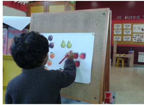
Figura 6 -Delimitação dos conjuntos

Quando terminaram de colar todas as imagens, as crianças repararam que havia imagens repetidas em cada uma das cartolinas. Em relação à cartolina dos legumes, existiam: uma alface, dois brócolos, cinco nabos, quatro cenouras, três cebolas. E na cartolina dos frutos, existiam: uma maçã, duas peras, três cerejas. Feita esta constatação, solicitei-lhes que agrupassem as imagens repetidas, fazendo um círculo em volta das mesmas, isto em relação a ambos os grupos de alimentos. Após terem circundado os alimentos repetidos, fizemos a contagem de quantos frutos e legumes existiam e que quantidade tinha cada conjunto de imagens. Importa ter em conta que, como afirmam Castro e Rodrigues (2008) “contar objectos implica o domínio de determinadas capacidades que (...), se vão desenvolvendo, experimentando e observando, sempre com o apoio do outro (adulto ou criança) e da contagem oral” (p.18).