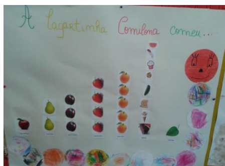
Figura 3- Sequência ordenada dos alimentos

Continuámos a explorar a história, no período da tarde desse dia, incidindo sobre o nome e sequência ordenada dos dias da semana. Para tal, coloquei uma folha de papel de cenário num dos placares, na qual escrevi os dias da semana. O grupo foi organizado em “U”, de modo a que todos pudessem ter boa visibilidade das palavras escritas na folha afixada e foram dispostos, à frente das crianças, cartões soltos indicando cada um dia da semana. Retirando e dizendo o nome do dia da semana, íamos colocando na folha o cartão com a palavra do dia que lhe correspondia. Li as designações dos dias, seguindo a sequência com que se apresentavam. A seguir, cada uma das crianças, uma de cada vez, foi colocar por cima da palavra do dia indicado os respetivos frutos e a indicação da quantidade dos mesmos, conforme o descrito na história (segunda, uma maçã; terça, duas peras; quarta, três amoras; quinta, quatro morangos; sexta, cinco laranjas; sábado, vários alimentos: uma fatia de bolo, um gelado, um pepino, um pedaço de queijo, um salame, um chupa-chupa, uma salsicha, um pastel e uma fatia de melancia). As crianças foram emitindo a sua opinião, manifestando se concordavam ou não com o indicado pelo colega. Terminado esse trabalho (figura 3), voltámos a visualizar as imagens da história, em powerpoint, no sentido de compararmos o que tínhamos feito com o apresentado nessas imagens, observando se correspondiam umas às outras. A imagem da figura 3 ilustra o trabalho realizado.