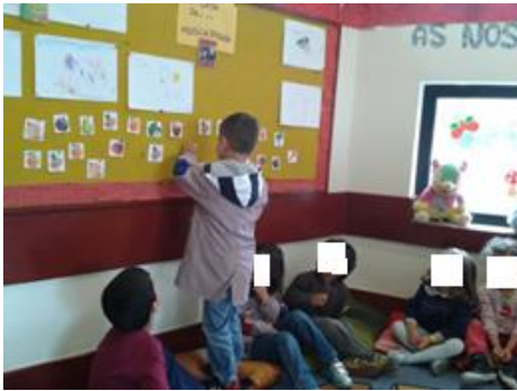
Figura 5 -Escolha de cada tipo de alimentos (fruta e legume)

imagens e propus-lhes, num primeiro momento, ir cada uma de sua vez, retirar uma imagem. Cada criança retirava a imagem, mostrava-a ao grupo e verbalizava se esta era um fruto ou um legume e em grupo refletíamos sobre a escolha efetuada. Para além das imagens existia ainda duas cartolinas, uma seria destinada para as imagens dos frutos e outra para os legumes. Após a reflexão em grupo cada criança colava a imagem na cartolina correspondente.