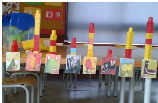
Figura 1- Gráfico de barras – Animal preferido

Sentados à volta de uma mesa de trabalho, colocámos uma folha de cartolina no centro da mesma, de modo a que todos pudessem observar e participar na elaboração do gráfico. No eixo horizontal da cartolina estavam representadas as imagens das personagens da história e no vertical foi representado o valor das escolhas efetuadas pelas crianças.