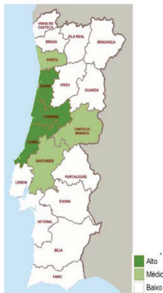
Figura 2: Ajustamento da rede de CSP à densidade populacional

No “ Estudo do Acesso aos Cuidados de Saúde Primários ”, efectuado pela ERS (Figura 1 e 2), foi considerado 30 minutos (distância em estrada, tempo de viagem até aos serviços recomendados, com o pressuposto de que “ todos os utentes têm acesso a transporte em automóvel privado, o que não corresponderá inteiramente à realidade ”, [28] (2009: p.28) em volta dos pontos da rede de Centros de Saúde, “ ignorando a questão da disponibilidade, qualidade e/ou diversidade de meios de transporte público, que claramente exerce efeito sobre o acesso em termos da proximidade, uma vez que se está a tratar de distância e tempo de viagem até aos estabelecimentos ” [28] (2009: p.28). Contudo, os CSP devem estar adequados às populações que servem.