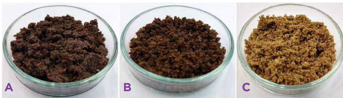
Figura 3. “Farinhas” de azeitona obtidas por diferentes métodos de secagem: A) Vácuo; B) Convecção por ar quente; e C) Liofilização.

azeitona verde” foi a que apresentou as maiores percentagens de ácido oleico e de tocoferóis totais. Estes produtos podem ser adicionados como ingredientes na constituição de molhos, maioneses (Figura 5), etc.. Também foram já elaborados snacks de azeitona, compotas e alcaparras aromatizadas, sendo o seu uso promissor.