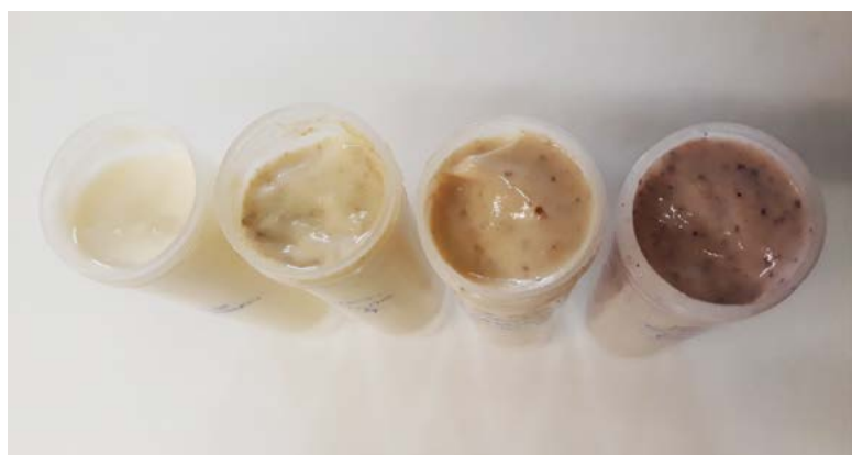
Figura 5. Maioneses elaboradas sem e com “farinhas de azeitona verde, mista e preta” (da esquerda para a direita, respetivamente).