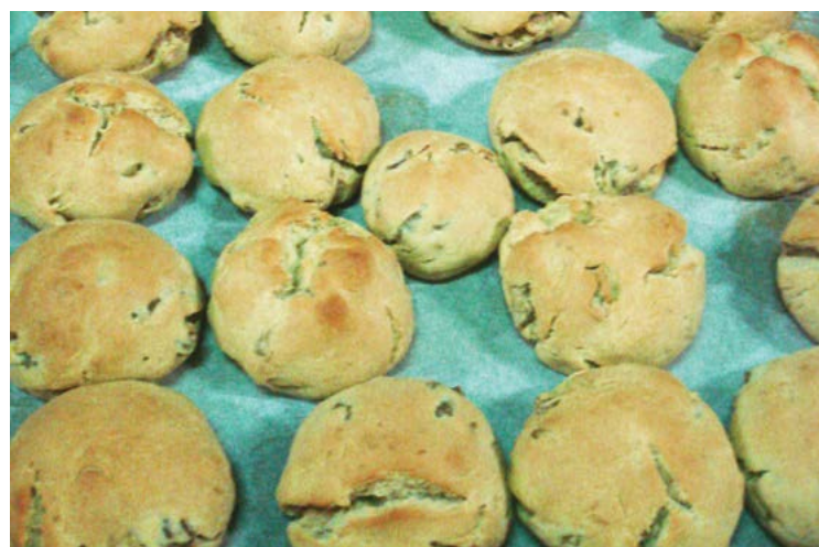
Figura 2. Pão de trigo e centeio (formulação sujeita a segredo industrial) com 7% de “alcaparras” com azeite.

ação do nosso grupo. Foi otimizado o processo de desenvolvimento de “farinhas” a partir da azeitona de conserva “cv. Negrinha de Freixo”, considerando três métodos de secagem – secagem por convecção com ar quente, vácuo e liofilização (Antunes, 2019). O último método demonstrou ser o mais rápido e que originou a farinha com melhor aparência visual (Figura 3).