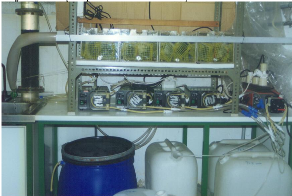
Figura 2: Instalação experimental durante a realização de um ensaio em contínuo.

Em cada experiência, os musgos foram expostos a uma solução aquosa de metal durante 144 horas, seguindo-se a exposição a água isenta de metal por um período de 192 horas. Amostras de musgo (um saco de cada vez) e de água de cada um dos tanques, foram retiradas a intervalos de tempo previamente definidos.