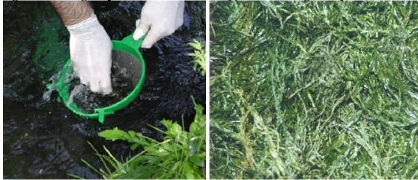
Figura 1: Musgo aquático Fontinalis antipyretica (lavagem e pronto a usar).

Os processos de remoção de metais usando bio sorventes, tais como musgos aquáticos, correspondem basicamente a um processo de contacto sólido/líquido em que há acumulação e dessorção do metal que, com o decorrer do tempo, tendem para um estado de equilíbrio. A instalação utilizada (Figuras 2 e 3) é similar à usada no estudo de processos como permuta iónica ou adsorção com carvão activado.