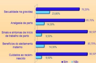
Gráfico 2- Quem lhe transmitiu o conhecimento