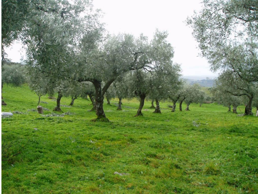
Fig. 2 – Aspecto dos olivais onde foi efectuada a recolha da informação

Dos três olivais considerados, o olival 1 é o de menor volume de copa (comparativamente com os restantes). Os olivais 2 e 3 têm volumes de copa semelhantes.