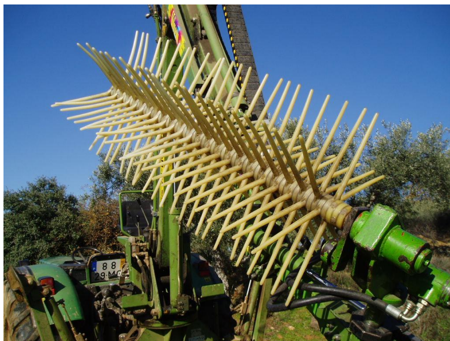
Fig. 6 – Pormenor do órgão activo