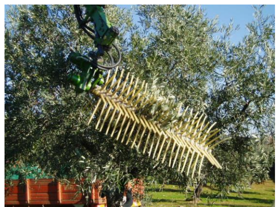
Figs. 4 e 5 – O órgão activo pode ser colocado em qualquer posição.