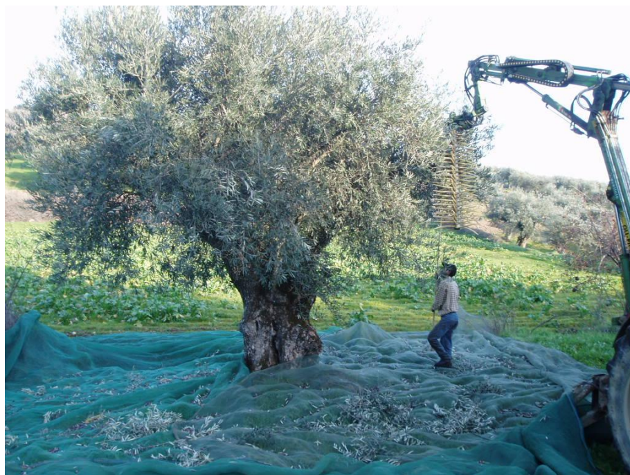
Fig. 9 – Oliveira de grandes dimensões: caso em que este colhedor é mais eficaz que os vibradores de tronco ou pernadas.

Deve ser salientada uma característica deste equipamento muito apreciada por alguns agricultores: é colhida a totalidade de produção de azeitona, o que na maioria dos casos não é possível com vibradores de tronco ou pernadas.