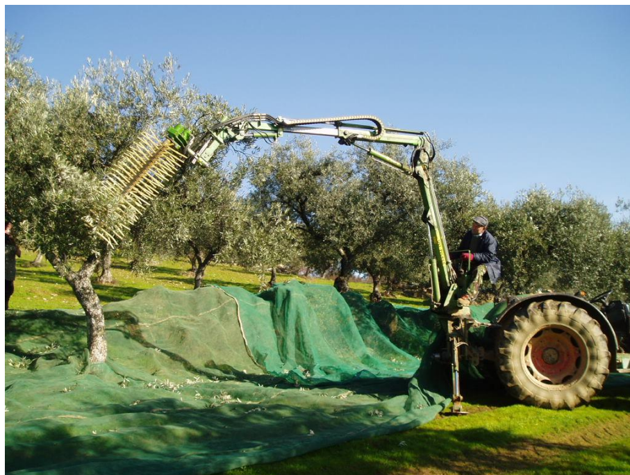
Fig. 1 – Colhedor de azeitona “Oli-Picker”.

Tendo sido iniciada em 2005/2006 a recolha de informação sobre o trabalho deste equipamento, apresentam-se alguns resultados preliminares.