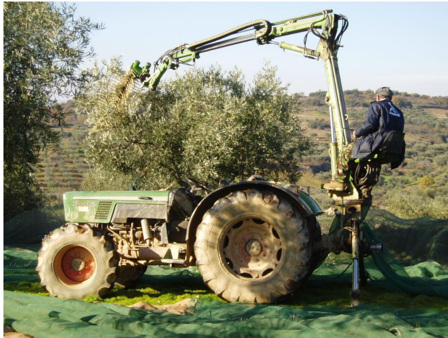
Fig. 3 – Equipamento em estação, sendo visíveis os seus constituintes.

A transmissão de potência faz-se através de um circuito hidráulico autónomo accionado pela tomada-de-força do tractor.