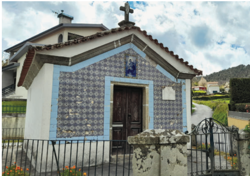
Figura 2 – A pequena capela de N. Sra. da Guia está construída junto da antiga via do Marão, no lugar onde existiu outrora a Albergaria da Campeã.

As albergarias terão assumido, na Idade Média, funções próximas das que mansiones e mutationes desempenhavam na época romana (Soutinho, 2021; Conceição, 2020). Desta forma, surge a questão de saber se a construção da Albergaria da Campeã, para além de ser necessária, teve também em conta uma longa tradição local de apoio ao viajante.