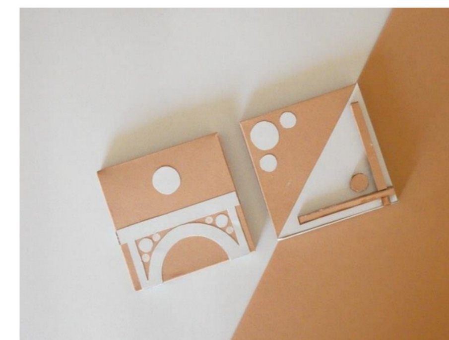
Fig.3 - Maquete física em cartolina

As duas bases foram concebidas, para que quem visita o Porto, leve consigo um pouco da cidade, e se recorde das boas sensações que experienciou quando por lá passou. Mas não só. Este conjunto de bases foi realizado para que possa harmonizar qualquer ambiente pelo seu carácter clássico da madeira e sofisticado do brilho do alumínio. Foram assim criadas peças ecléticas, intemporais que por mais simples que pareçam, têm em si um grande carisma.