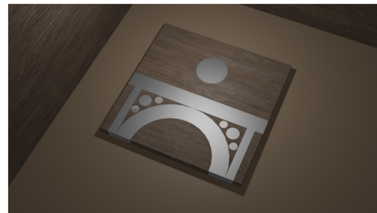
Fig.1 - Maquete digital

Primeiramente foi feita uma pesquisa da ponte escolhida como fonte de inspiração. A seguir foi feita outra pesquisa acerca dos materiais a ser utilizados, uma madeira e um metal. Os materiais escolhidos foram a madeira maciça de carvalho e o alumínio. O passo seguinte foi realizar alguns esboços. Depois de escolhido o design das peças foram feitas as maquetes digitais no Blender e as maquetes físicas em cartolina.