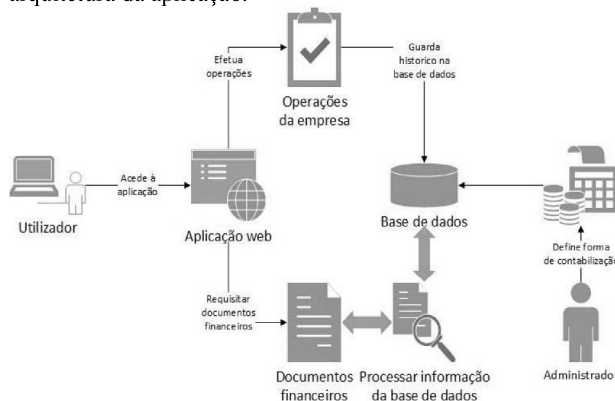
Figura 1- Arquitetura da Aplicação SimEmp

O SimEmp é uma aplicação web , ou seja, uma aplicação disponível através de uma página web utilizando qualquer browser [10]. Como explicado em [11] e [12], não precisa de software adicional, do lado do utilizador. Foi desenvolvido utilizando uma web framework denominada “ Yes it is! ”, mais conhecida por Yii . As Frameworks de software oferecem soluções para problemas de programação mais comuns, com o objetivo de eliminar operações repetitivas [13], [14], [15]. De acordo com [16], [17] e [18], a Yii caracteriza-se por uma framework da linguagem Hypertext Preprocessor (PHP) [19], baseada em componentes de alto desempenho para o desenvolvimento rápido de aplicações web modernas. Como a maioria das frameworks PHP, a Yii implementa o padrão arquitetónico Model-View-Controller (MVC) e promove a organização do código com base nesse padrão. Tal como descrito em [20], [21] e [22], MVC é um padrão de referência na conceção de software , universalmente aceite, em várias linguagens de programação e estruturas de implementação, usado para criar aplicações web . A Figura 1 apresenta a arquitetura da aplicação.