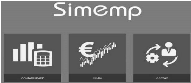
Figura 3 – Acesso e Registo no SimEmp

Com o acesso e registo ao SimEmp disponibilizado em http://simemp.ipb.pt/ surge a opção apresentada na Figura 3, para escolher o tipo de simulação empresarial pretendida.