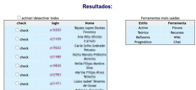
Figura 2 – Relação entre os estilos de aprendizagem e as ferramentas utilizadas

Este módulo identifica quais as ferramentas do Sakai mais usadas, em função do estilo de aprendizagem, permitindo aferir a relação entre os estilos de aprendizagem e as ferramentas utilizadas (Figura 2).