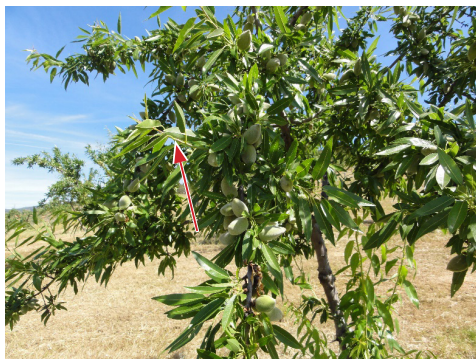
Figura 2 – Colheita de amostras de folhas