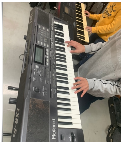
Fig.11 – Teclados/sintetizadores