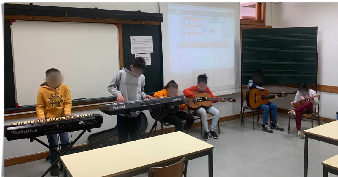
Fig. 9 – Música de Conjunto - Exploração de instrumentos

Estas atividades de experimentação destes instrumentos musicais, que os alunos estão habituados a ouvir nas músicas do seu quotidiano, desempenharam neste projeto o papel fundamental na consolidação de conceitos e competências musicais essenciais para a realização das atividades inerentes ao projeto principal.