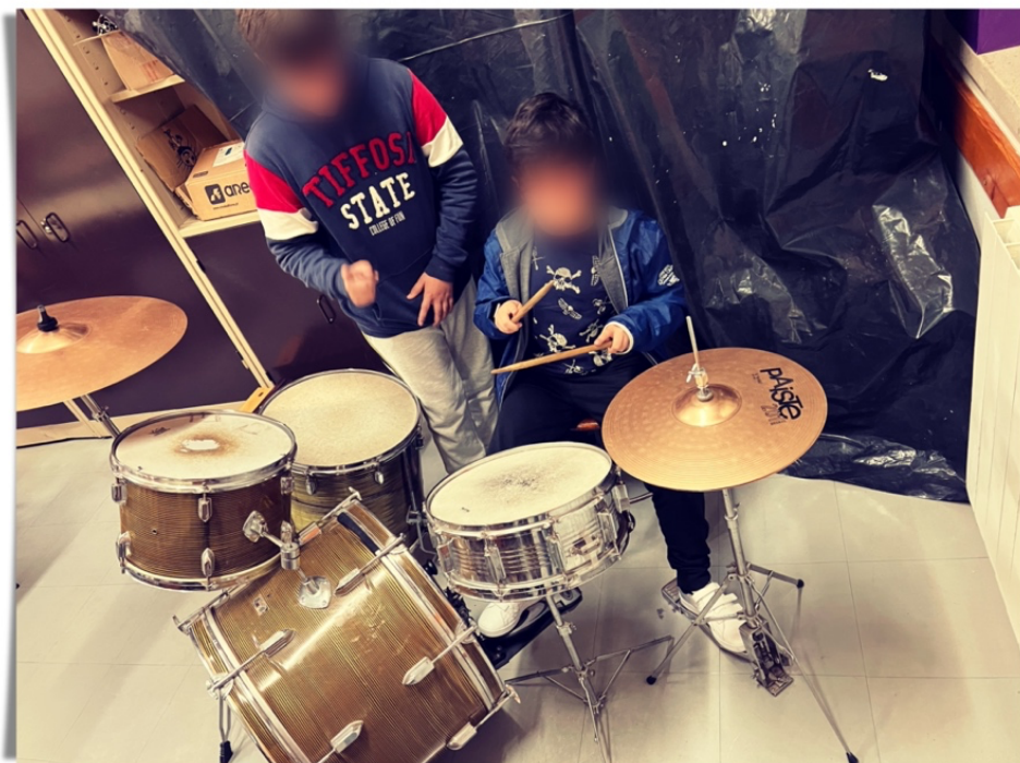
Fig. 5: Trabalho colaborativo entre colegas.

Deste modo, a aprendizagem colaborativa traz, para a sala de aula, uma nova forma de estar, pois é proporcionado aos alunos “(...) uma série de atividades, através de uma metodologia servida por um conjunto de técnicas específicas a utilizar em situações educativas”, como menciona Freitas e Freitas (2003, p.9). No fundo, no processo de aprendizagem colaborativa “(...) os alunos atuam como parceiros entre si e o professor, visando adquirir conhecimentos sobre um dado objeto” (Lopes & Silva, 2009, p. 4) (ver fig.5). De acordo com esta linha de pensamento, desenvolvi um projeto em que os alunos cooperam com o professor, construindo o caminho de ensino/aprendizagem. De facto, “(...) se queremos contribuir para o desenvolvimento cívico de cidadãos participativos desde os anos da infância, temos de providenciar experiências onde as crianças se sintam participantes, se sintam com poder (Oliveira-Formosinho, 2008, p. 70), pois é a participar que