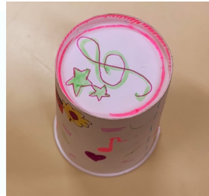
Fig. 7 – copo percussivo