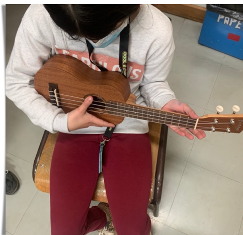
Fig.12 – Ukulele