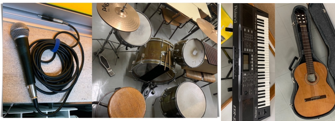
Fig.2: Materiais: Microfone; bateria acústica; piano; guitarra.

A autorização foi-me cedida e a sala de aula que me foi destinada está equipada com os instrumentos musicais necessários. Além das cadeiras e mesas dos alunos, há uma secretária para professor equipada com computador com um sistema de som integrado e retroprojetor. A sala tem instrumentos Orff de altura definida e indefinida 1 , uma bateria acústica, duas guitarras acústicas, dois sintetizadores/teclados, um microfone, uma mesa de som e um amplificador (ver fig.2).