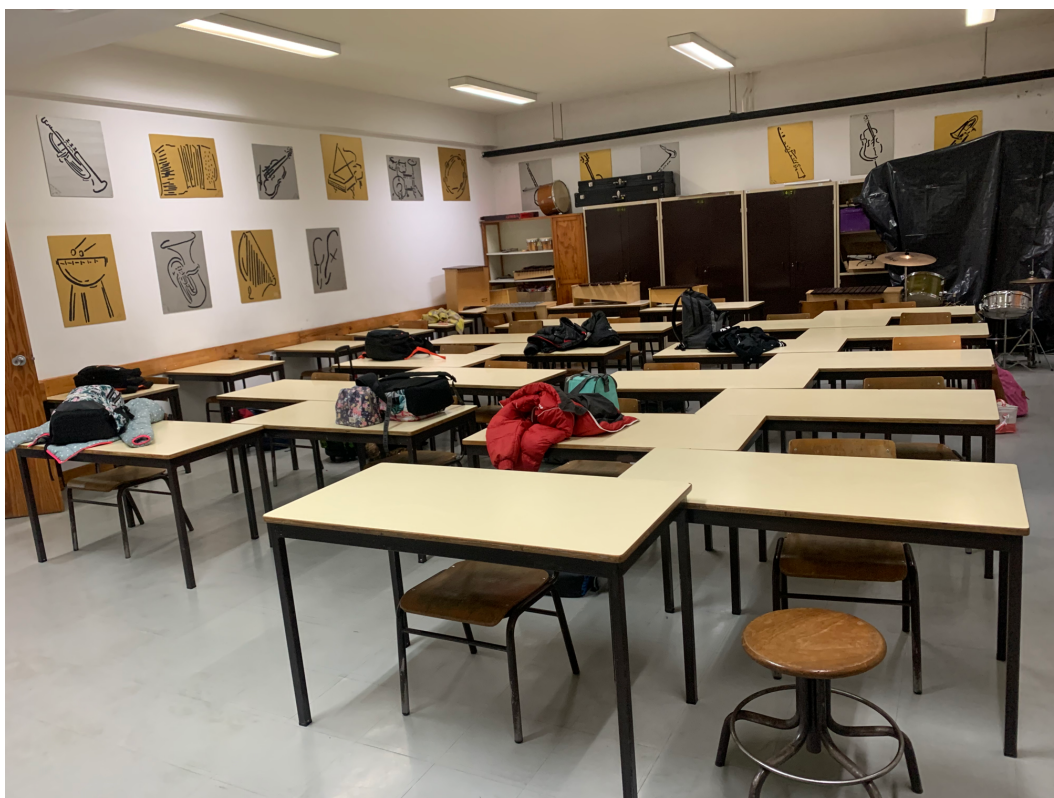
Fig. 3: Sala de aula