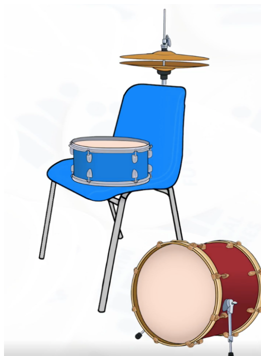
Fig. 8 – Chairdrumming