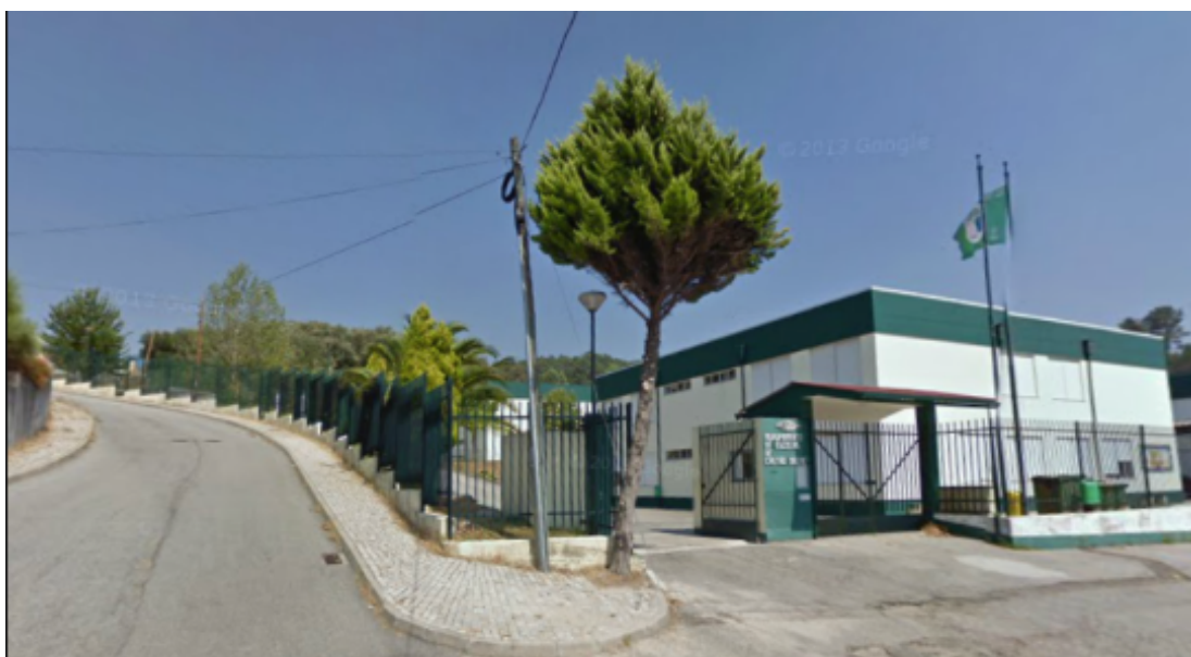
Fig.1: Escola Básica n.º 2