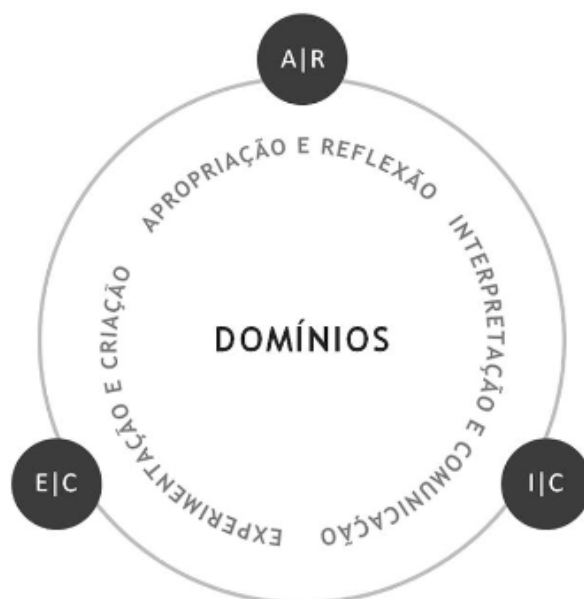
Fig.4: Domínios das aprendizagens essenciais

Através da criação de uma ou mais canções que os alunos podem desenvolver competências de exploração/experimentação sonoro-musicais, improvisação e composição musical. Também se pretende, com a implementação deste projeto, que os alunos desenvolvam competências relativas à performance/execução musical, bem como as relativas formas de comunicar/ partilhar publicamente as performances e criações que eles próprios interpretam. Em concordância com Lazarim (2005) “(...) o fazer musical deve ser o centro de toda a Educação Musical” (p.109), o que faz com que cada músico possa experienciar enquanto aprende, ao que o autor apelida de thinking-in-action 2 , já que o conhecimento deve transmitir-se de forma ativa e não passiva.