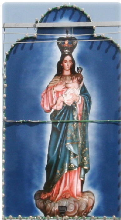
Fig. 3 - Imagem de Nossa Senhora dos Remédios que sai na procissão.