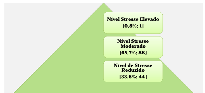
Figura 2 – Enfermeiros distribuídos por Nível de Stress

Os enfermeiros registaram um nível de stress moderado (Média=34,2 DP±4,96). A distribuição dos inquiridos pelo nível de stress foi o seguinte: 33,6% (44) manifestaram um nível de stress reduzido; 65,7% (86) mostraram ter um nível moderado de stress e 0,8% (1) registaram um nível elevado de stress (figura 2). O Distrito não se mostrou diferenciador ( t=0,443 ; p=0,658 > 0,05 ) do nível de stress dos enfermeiros (Vila Real: Média=34,1; DP±5,1 e Bragança: Média=34,4; DP±4,8).