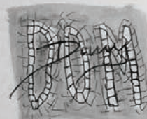
Centro Cultural DOM DINIS Universidade de Coimbra