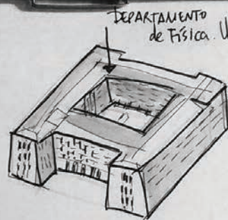
DEPARTAMENTO de Física. Universidade de Coimbra