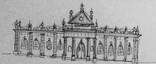
MUSEU DA CIÊNCIA Universidade de Coimbra