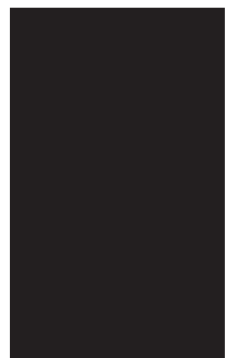
ILUSTRAÇÃO Science sketcher