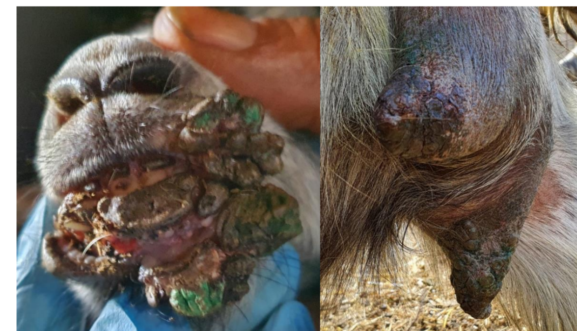
Fig 1. Ectima Contagioso.

A estagiária teve a oportunidade de aplicar os conhecimentos adquiridos ao longo do curso, nomeadamente, no diagnóstico de doenças (Fig. 1), na recolha de amostras de sangue (Fig. 2), na vacinação, no diagnóstico de gestação e na assistência a partos (incluindo partos distócicos),.