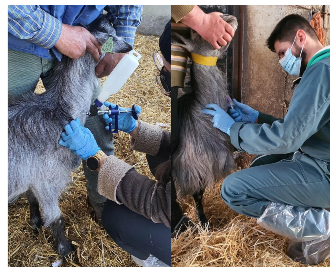
Fig 2. Vacinação (esquerda) e recolha de sangue (direita)