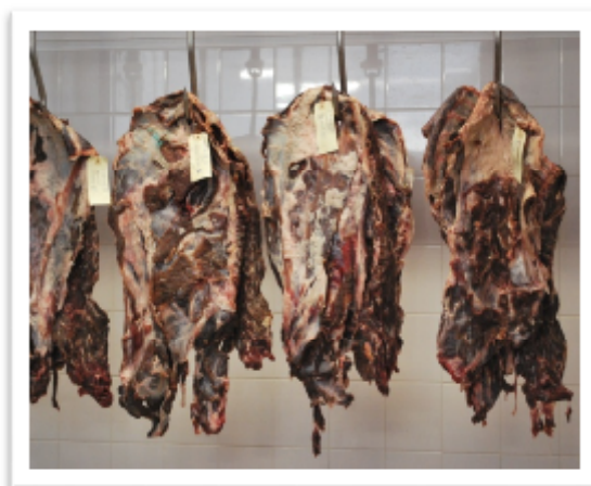
Figura 3. Mantas en proceso final de secado.

Considerando el valor final de la actividad de agua obtenido en el proceso de secado se procedió al empacado de las piezas al vacío (ver Figura 4) y se almacenaron en la cámara de refrigeración a 4 °C.