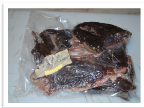
Figura 4. Mantas empacadas al vacío.

Considerando el valor final de la actividad de agua obtenido en el proceso de secado se procedió al empacado de las piezas al vacío (ver Figura 4) y se almacenaron en la cámara de refrigeración a 4 °C.