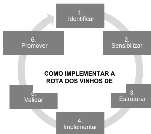
Figura 2. Modelo macro para a implementação da Rota dos Vinhos de Trás-os-Montes.

Neste seguimento apresenta-se o modelo infra, que sugere sumariamente seis etapas recursivas para a implementação da Rota dos Vinhos de Trás-os-Montes.