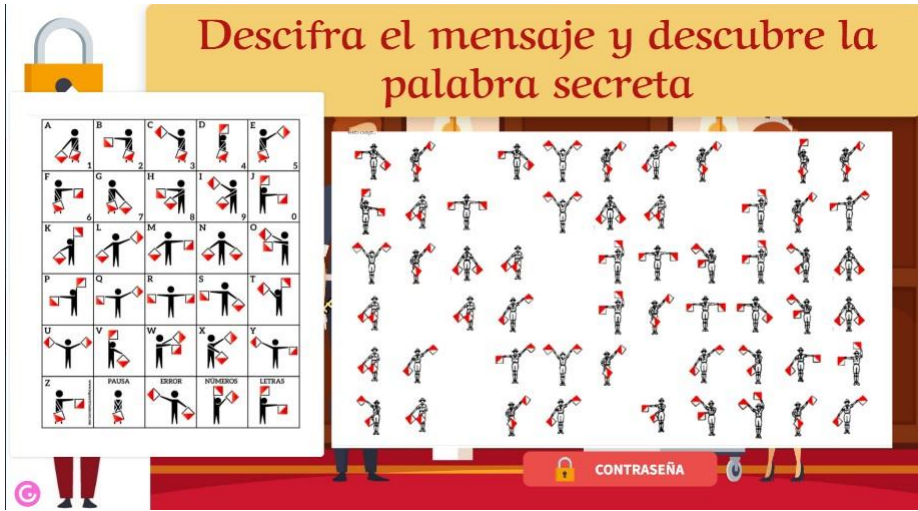
Figura 3 Criptograma