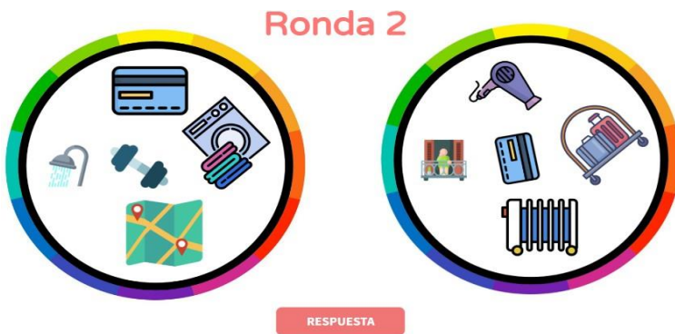
Figura 2 Dobble