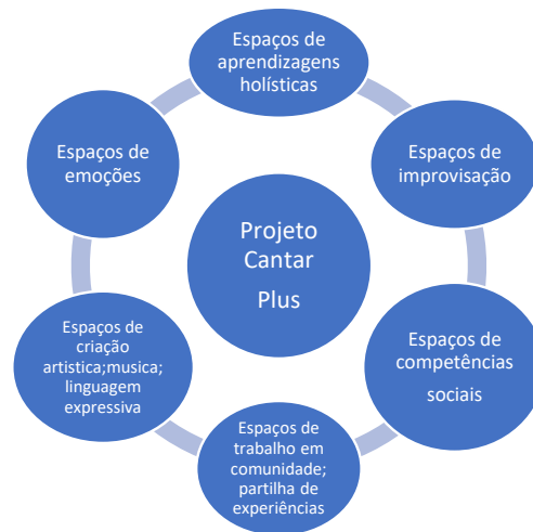
Figura 1 Síntese do Projeto Cantar Plus