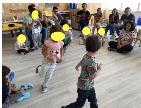
Figura 4 Espaços dos Jogos Musicais

Por outro lado, as canções compreenderam um trabalho constante no que concerne à utilização do corpo. Deste modo, foi trabalhada a coordenação motora através dos jogos musicais (Figura 4), de coreografias resultantes de cada canção e ainda foram utilizados diferentes instrumentos musicais para o efeito pretendido (Figura 5) em função de cada canção.