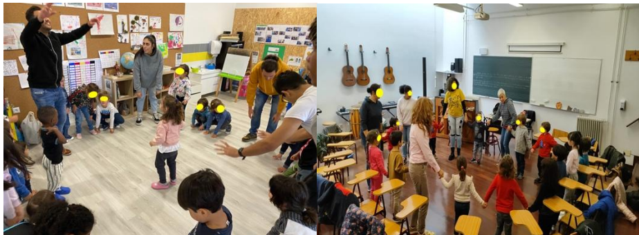
Figuras 8 e 9 Espaços de Trabalho de Grupo

Podemos entender que, através do ato de cantar, as crianças aprenderam canções, criaram diferentes e diversificadas composições artísticas, perceberam outras competências motoras e sociais individuais e de grupo. Julga-se que este género de ações, em instituições de solidariedade social possa apresentar-se enquanto forma de integração e socialização bilateral, como alavanca para reforçar a educação artística e musical, para fomentar a criatividade e aprendizagem total, bem como uma forma de gerir e canalizar emoções das crianças pequenas.