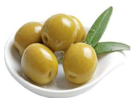
Fig. 1 – Azeitonas Fermentadas

Logo se espera que o US substitua o processo de homogeneização e tratamento térmico na fabricação da pasta de azeitona, simplificando o processo de fabricação.