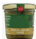
Fig. 2 – Pasta de Azeitona