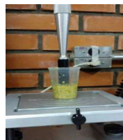
Fig. 4 – Análise de textura