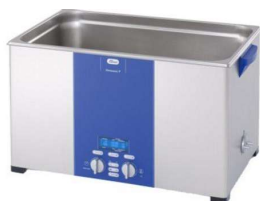
Fig. 3 – Banho de Ultrassom

As análises estatística foram realizadas com o Statistica 7.0 (Statsoft) e os efeitos da Potência e tempo de sonificação nos parâmetros de textura foram calculados (P<0,05). Os resultados entre a pasta de azeitona tradicional e a sonificada foram comparados pelo teste de Tukey (P<0,05).