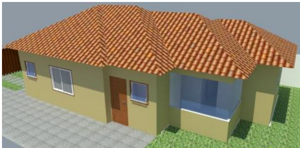
Figura 2a: Edificação de estudo.