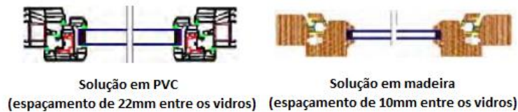
Figura 3: Detalhamento dos vãos envidraçados, fonte: [14].

Para estudar o comportamento térmico das opções envidraçadas será analisado dois tipos de materiais, sendo uma em pvc e outra em madeira, Figura 3, ambas constituídas por vidro duplo 4mm. As envoltentes envidraçadas são vãos que apresentam uma área de vidro igual ou superior a 25% da sua área total, sendo assim, sua caracterização é estabelecida por norma [18] e o valor de U = 2,20 [W/(m 2 .°C)]. Então, como o coeficiente de transmissão térmica de ambas é igual, para definir o material ideal deve-se considerar a análise de sustentabilidade e optar pela opção mais sustentável.