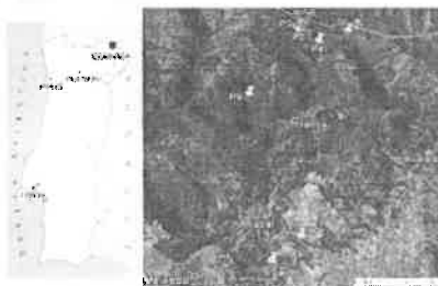
Figura 1: Localização da mina e das estações de amostragem.

As minas desativadas do Portelo localizam-se no Parque Natural de Montesinho. As amostragens de água e de macroinvertebrados realizaram-se de 2010 a 2012 nos pontos perturbados pelo acidente (P1, P3, P4, P4) e em pontos não perturbados pelo mesmo (P2, P6, P7, P8, P9) (Figura 1).