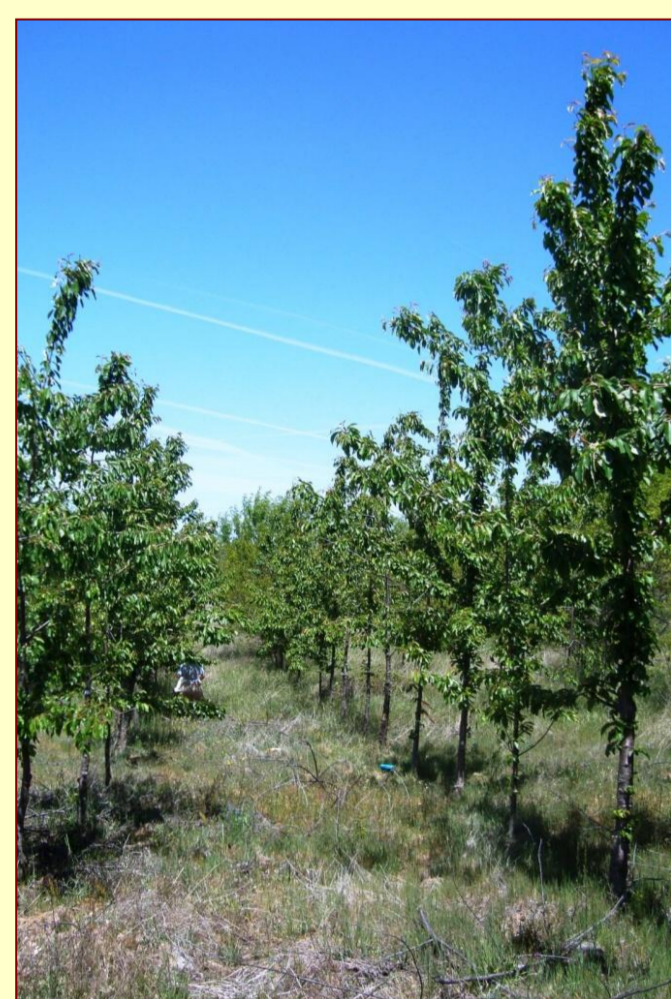
Tratamento puro de Prunus avium

O presente trabalho teve lugar num ensaio de plantações mistas, instalado em 1998, no concelho de Vimioso no Nordeste Transmontano. Para o estudo consideraram-se os seguintes tratamentos: puro de Prunus avium (PC), puro de Robinia pseudoacacia (PR) e Prunus avium x Robinia pseudoacacia (MRC) consociada na linha de forma alternada, instalados com um compasso de 3x2 m. Em cada tratamento foram considerados 4 pontos de amostragem. A recolha de amostras de solo para a determinação dos parâmetros microbianos foi realizada na Primavera, à profundidade de 0-10 cm.