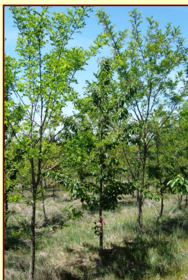
Tratamento misto Prunus avium x Robinia