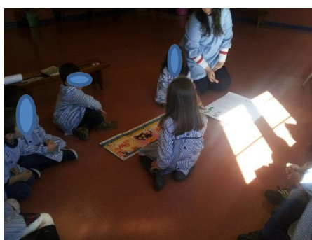
Figura 8 - Atividade de grande grupo - "Eu escolho o meu livro"

Tendo como referência o diálogo, procedeu-se a realização da atividade em grande grupo, esta tinha como base o “poder de escolha”, este seria um poder um pouco limitado. À disponibilidade das crianças estavam quatro livros, cada criança teve a oportunidade de observar muito bem a capa, conteúdo e contracapa, sem saberem nunca o título e tema das histórias. Cada criança escolheu o livro que queria ouvir. As crianças poderiam visualizar a capa e a contra capa de forma a poderem fazer uma escolha na sua preferência, as crianças não saberiam qual o tema retratado em cada história. As capas apresentavam-se ilustradas com desenhos bastante apelativos, cada criança fez recair a sua escolha pela preferência do desenho presente na capa do livro.