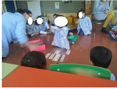
Figura 7 - Atividade de grande grupo - Família das palavras de Corpo Humano

A figura atrás retrata o momento da escolha das palavras por parte das crianças, cada uma delas teve a oportunidade de interagir e participar na atividade em destaque. Todas as crianças procuraram, primeiramente, palavras que fizessem parte da família de palavras de corpo humano, mas como seriam escolhas aleatórias, por vezes a palavra vinha associada à primavera. Foi uma atividade bastante produtiva, na medida em que ajudou as crianças a perceberem o conceito de família de palavras, neste caso associadas ao corpo humano. Criando, de seguida, elas mesmas famílias de palavras referentes a outros temas à escolha.