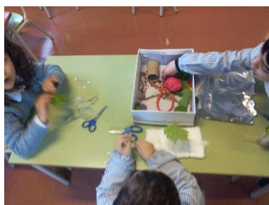
Figura 14 - Atividade de pequeno grupo - O meu extraterrestre

Como podemos visualizar na figura atrás retratada, os materiais eram naturais, com os quais convivemos diariamente, a diversidade era grande e as crianças encontravam-se separadas por mesas. Desta forma a concessão dos extraterrestres seria individual e não uma cópia do colega do lado, em cada mesa estariam duas ou três crianças para a concessão do seu próprio extraterrestre, cada mesa teria uma caixa com diversos materiais.