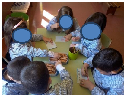
Figura 10 - Atividade de pequeno grupo - Os nossos direitos e deveres

Na figura pode-se ver o envolvimento das crianças na concessão da atividade, antes da realização do desenho referente ao direito ou dever verbalizado por cada uma, houve um diálogo em que se tentou perceber mesmo se as crianças saberiam o que seria um direito e um dever e qual a sua importância na sociedade e para nós mesmos. Depois de esclarecidas algumas dúvidas que foram surgindo, cada criança disse um direito e/ou um dever ao qual teria de associar o seu respetivo desenho, e é isso mesmo que se pode visualizar na figura atrás retratada.