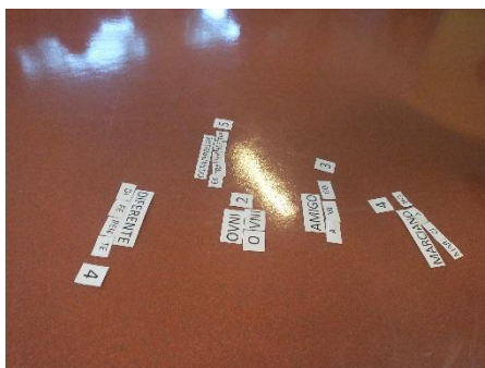
Figura 13 - Atividade de grande grupo - Divisão silábica

A atividade de grande grupo foi concretizada com sucesso como se pode visualizar na imagem, estas foram algumas das palavras divididas silabicamente, pelas crianças, sendo-lhes associado um número correspondente ao número de sílabas. As crianças, habitualmente, e de livre vontade, realizavam atividades envoltas na área do português, visto na sala existir uma área da escrita. Este fator facilita a aprendizagem livre de cada criança sobre a escrita e os seus componentes, como é exemplo, a divisão silábica. Essa aprendizagem decorreu da curiosidade da própria criança, sendo que o adulto responsável apenas lhe transmitia o incentivo necessário, pois essa aprendizagem não deve ser forçada e com o intuito de ensinar o português, sendo isso como que “criminal” para com as crianças da EPE.