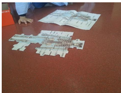
Figura 6 - Atividade de Grande Grupo - Construção do puzzle referente ao esqueleto humano

A figura retratada, é referente à primeira atividade, nela podemos visualizar a construção do puzzle referente ao esqueleto humano. Foi uma atividade em grande grupo e que, como se constata pela imagem, foi realizada de forma ordeira e em que todas as crianças puderam participar, repetidamente, na medida em que cada criança conseguiu colocar 2 peças do puzzle. A imagem não capta o envolvimento das crianças de forma clara, mas pela construção em processo, esse envolvimento tornou-se mais específico e era também visível o sucesso com que a atividade se estava a desenvolver.