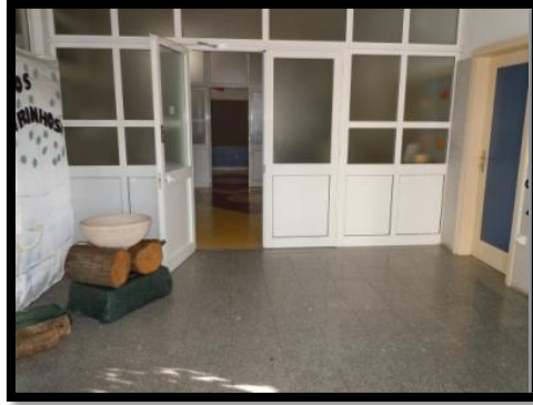
Figura 2 - Porta principal

É uma entrada bastante ampla, onde se faziam os respetivos acolhimentos aos pais das crianças, a entrada mais interna dispunham de um vestiário onde os pais guardavam as lancheiras das respetivas crianças no espaço seu destinado, dispunham ainda de um caderno em que os pais assinavam na hora da chegada e da partida ao final do dia. Os vestiários individuais das crianças, local onde estas colocavam os seus pertences. O espaço polivalente (figura 3) era uma sala ampla que servia como ginásio para as sessões de expressão motora, sala de recreio e atividades coletivas, no qual se encontravam bancos e brinquedos.