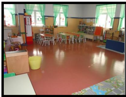
Figura 4 - Sala dos 4 anos (local da PES)

A sala dos 4 anos, onde decorreu a PES, era uma sala que oferecia condições bastante favoráveis ao desenvolvimento das crianças, dispunham de seis áreas: área da casinha, da biblioteca, das construções, da escrita, da expressão plástica e a área dos jogos, possuía ainda um espaço central bastante amplo para o convívio em grande grupo.