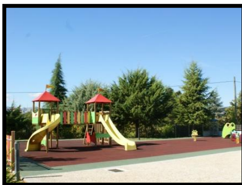
Figura 5 - Parque Infantil (Exterior)

O espaço exterior oferecia às crianças, para além de atividades livres, várias oportunidades e potencialidades para momentos educativos intencionais. Desta forma o espaço exterior era constituído por: um parque com piso amortecedor e diversos equipamentos lúdico-desportivos e uma caixa de areia (figuras 18 e 19). Um campo de jogos que facilitava a realização de atividades de expressão física ao ar livre, assim como um espaço de horticultura e um terreno relvado.