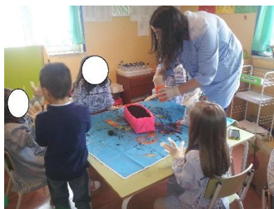
Figura 12 - Atividade de pequeno grupo - A nossa plantação

A atividade de pequeno grupo consistiu na concessão de uma plantação de alfaces. Cada criança teve à sua disponibilidade o material necessário para fazer parte desta mesma plantação, foram as crianças que colocaram a terra e que plantaram as sementes das alfaces, como é notório na figura apresentada. Torna-se indispensável e crucial, disponibilizar material de igual forma pelas crianças do pequeno grupo, daí se fazerem estas práticas de atividades em pequenos grupos, as crianças devem ter a oportunidade de contactar diretamente com materiais diversos, foi uma atividade bastante enriquecedora na medida em que um pequeno número de crianças do pequeno grupo nunca tinha tido contacto direto com terra ou semente. Não sabem, à partida o que seriam sementes ou qual a forma destas. O balanço foi positivo, de tal forma que as outras crianças do grande grupo também queriam fazer a atividade, não sendo possível, ficaram todas elas responsáveis pela constante rega da plantação.