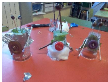
Figura 15 - Atividade de pequeno grupo - O meu extraterrestre

Esta foi uma atividade de baixo custo ou mesmo nenhum, deu-se prioridade a materiais do quotidiano das crianças e alguns naturais, como folhas e paus. As crianças construíram verdadeiras obras de arte, tudo partiu da imaginação e criatividade delas, crianças do grande grupo quiseram também elas fazer a atividade, esta ficou programada para um outro dia como se veio a verificar.