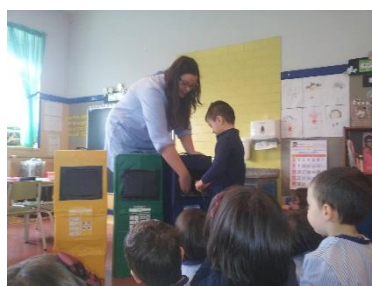
Figura 11 - Atividade de grande grupo – Reciclagem

Havendo resíduos compostos por mais que um material, foi necessário proceder com mais atenção à sua separação, o que para as crianças não se verificou ser um problema, elas próprias destacaram a necessidade desses materiais terem de ser separados aquando da sua respetiva separação.