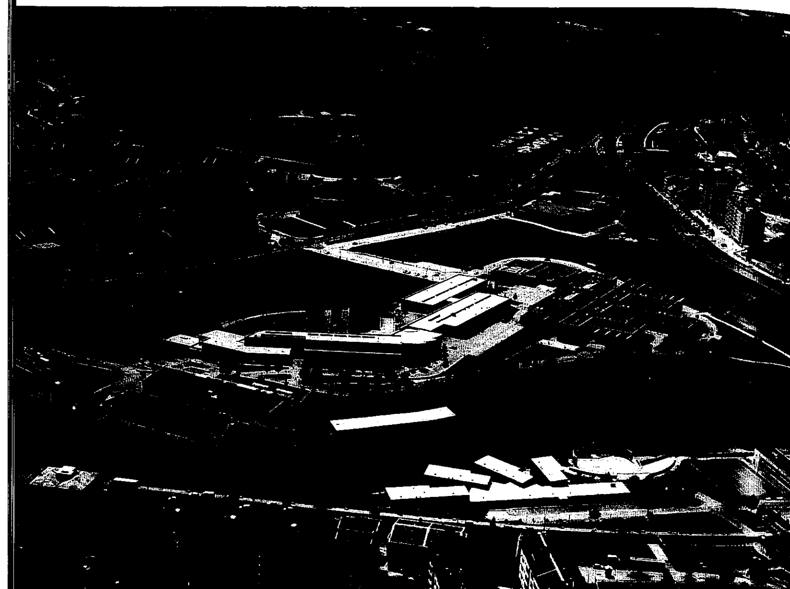
Campus do Instituto Politécnico de Bragança

38 por cento e em 2008, 10 por cento. Filhos bastardos de Minerva!