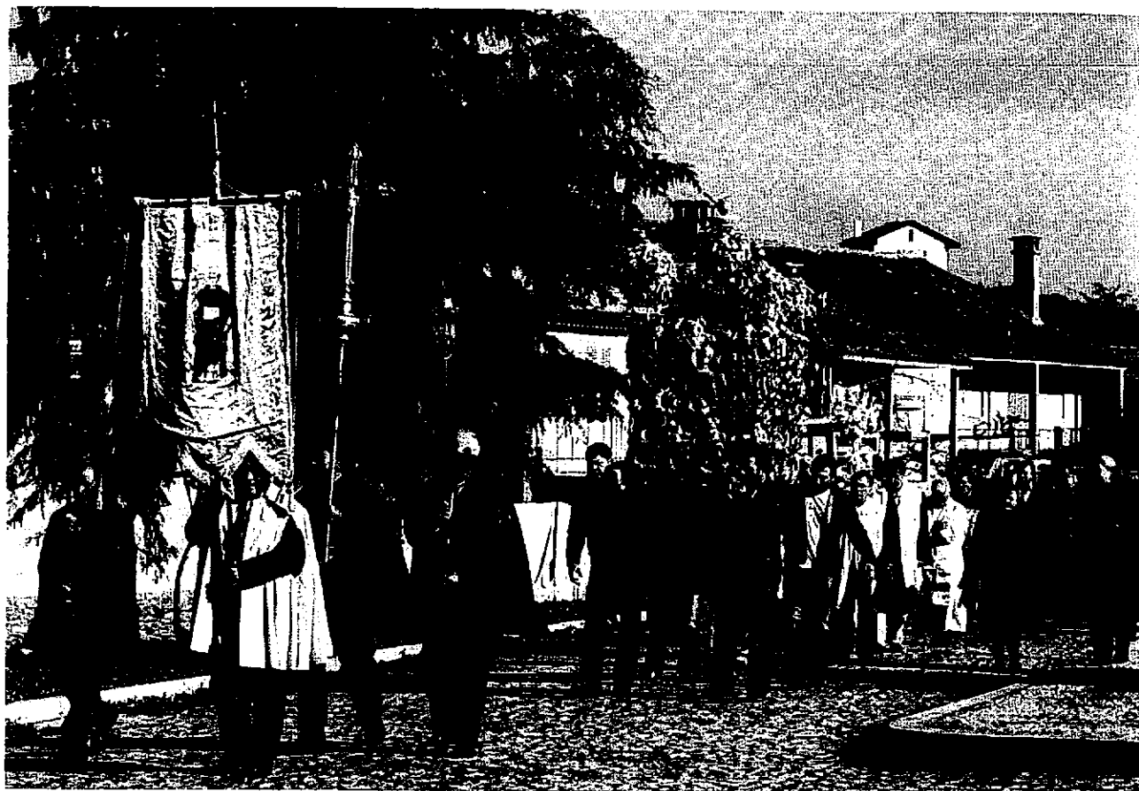
Festa do Charolo, em Outeiro

jovens. Por aqui e por ali existem pequenas comunidades de espiritualidade formadas por leigos que vão alimentando e aguentando a vida espiritual da Igreja diocesana.