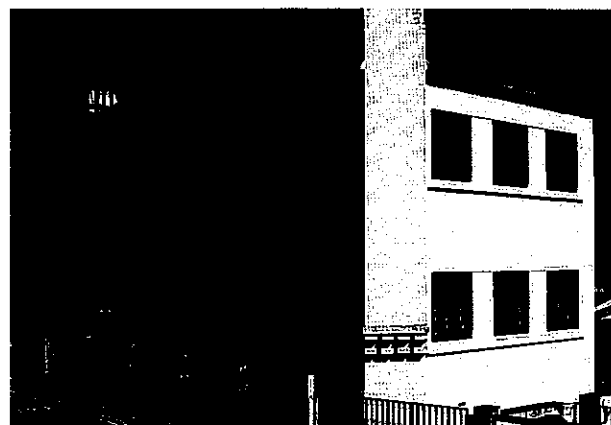
Escola Primária (Plano dos Centenários)

logo em 1928, foi construindo, a partir de 1930, a nova ordem educacional: o Ensino Primário foi reduzido de cinco para três anos, entre 1931 e 1933 (note-se que, na I República, a escola obrigatória também nunca tinha sido de mais de três anos), e, entre 1937 e 1948, foi imposto o livro único de leitura para cada uma das três primeiras classes, o qual vigoraria até à reforma do currículo do Ensino Primário, em 1968, já promovida por Marcelo Caetano e José Hermano Saraiva.