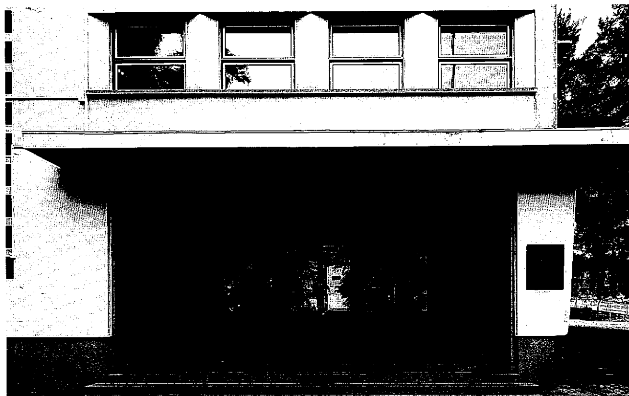
Escola Secundária Abade de Baçal, antiga Escola Industrial e Comercial