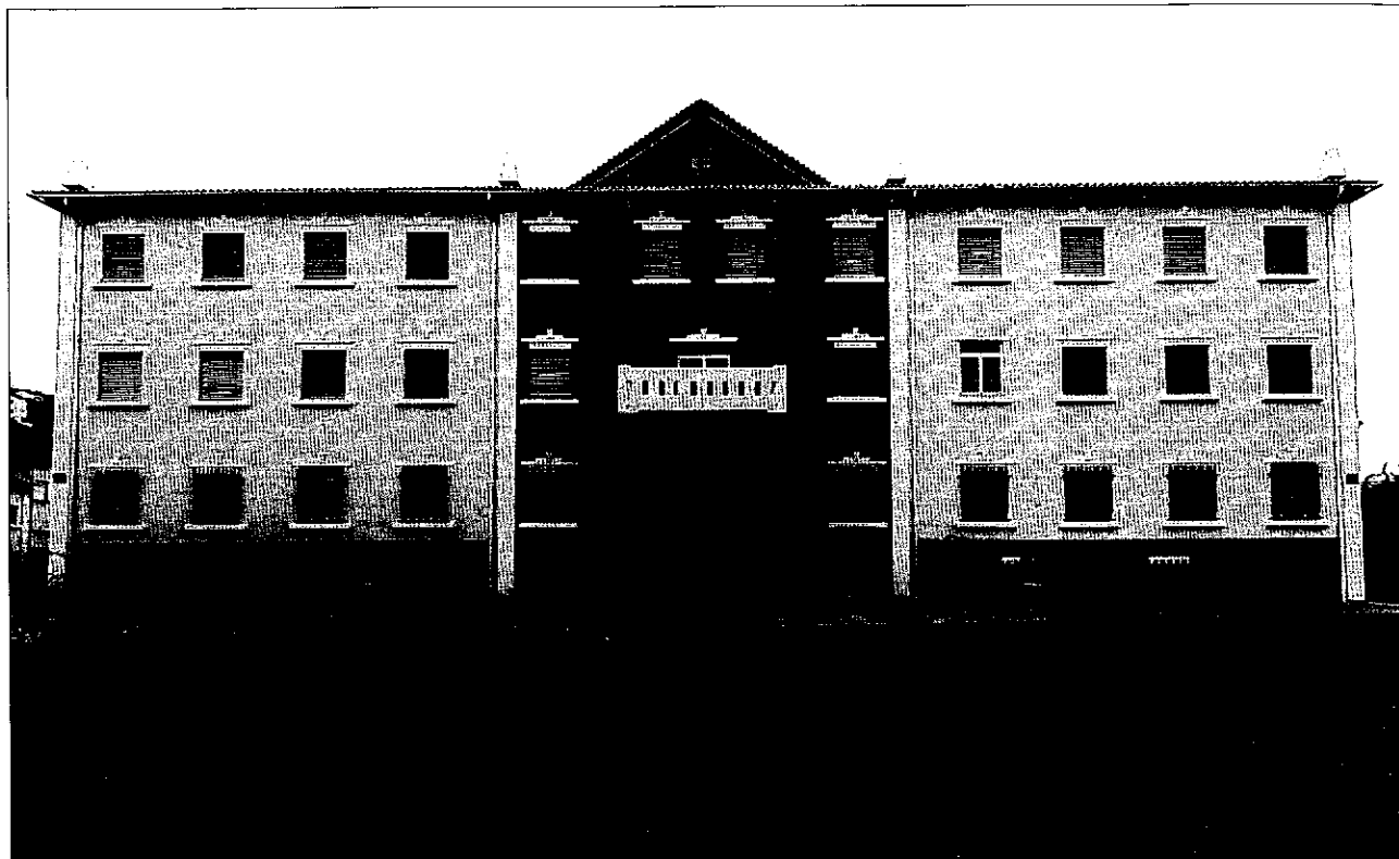
Colégio de São João de Brito