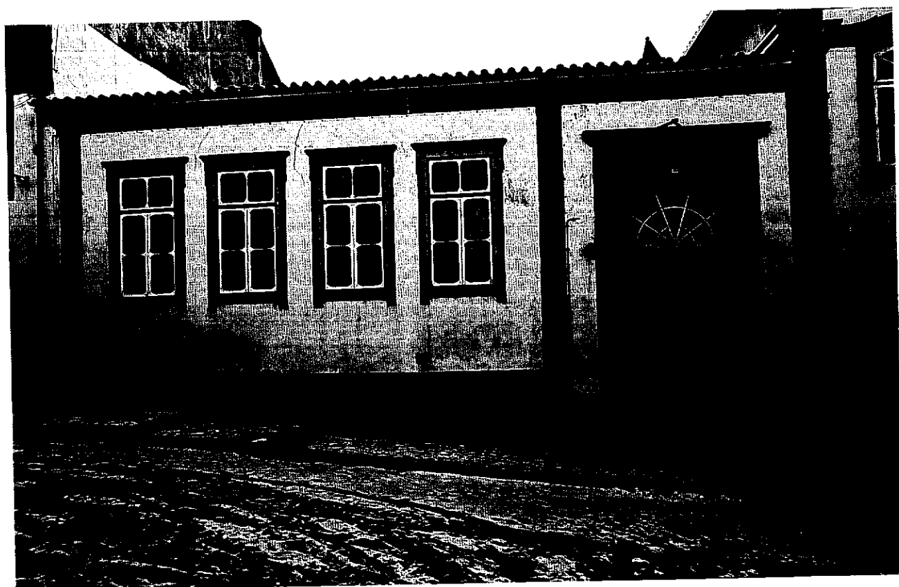
Primeira Escola Pré-Primária (1934)

alguns professores e de autoritarismo do regime, através de uma palmatória de madeira grossa e pesada a abater-se impiedosamente com violência nas mãos das crianças e que adquiriu expressões sociais diversas), a obrigatoriedade de os professores terem 25 por cento de sucesso nos exames de 4.ª classe para não terem avaliação negativa, crianças com fome, professores a viverem ao lado da loja do burro, numa pseudo-habitação sem casa de banho e sem água canalizada, professores a terem de andar a pé dez quilómetros para chegarem à escola por caminhos de cabras. Era assim o Portugal dos anos 40 e, no Interior, ainda o dos anos 70. Nesse aspecto e em outros, o poder local mudaria a face do país, a partir de 1976.