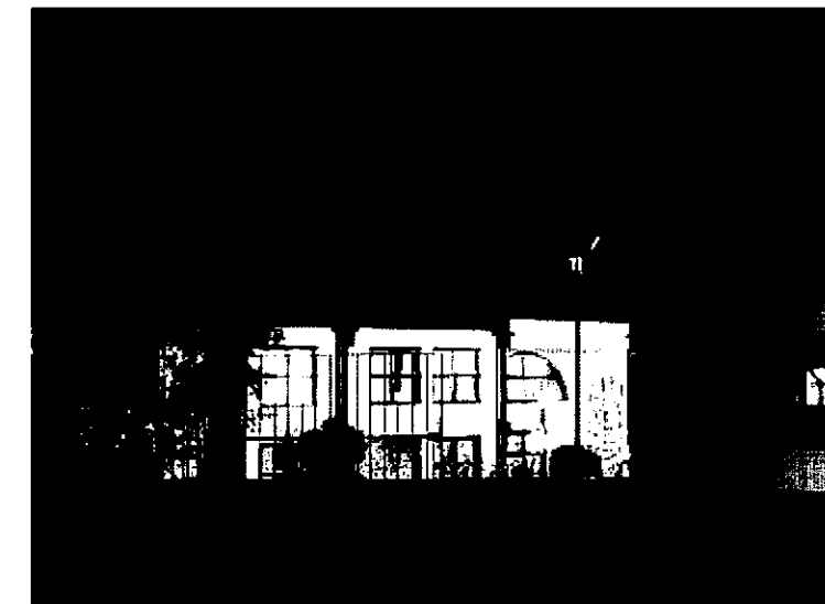
Escola Secundária Miguel Torga

Em 1864, 95 por cento da população era analfabeta, em 1911, 78 por cento, em 1940, 55,6 por cento, em 1970,