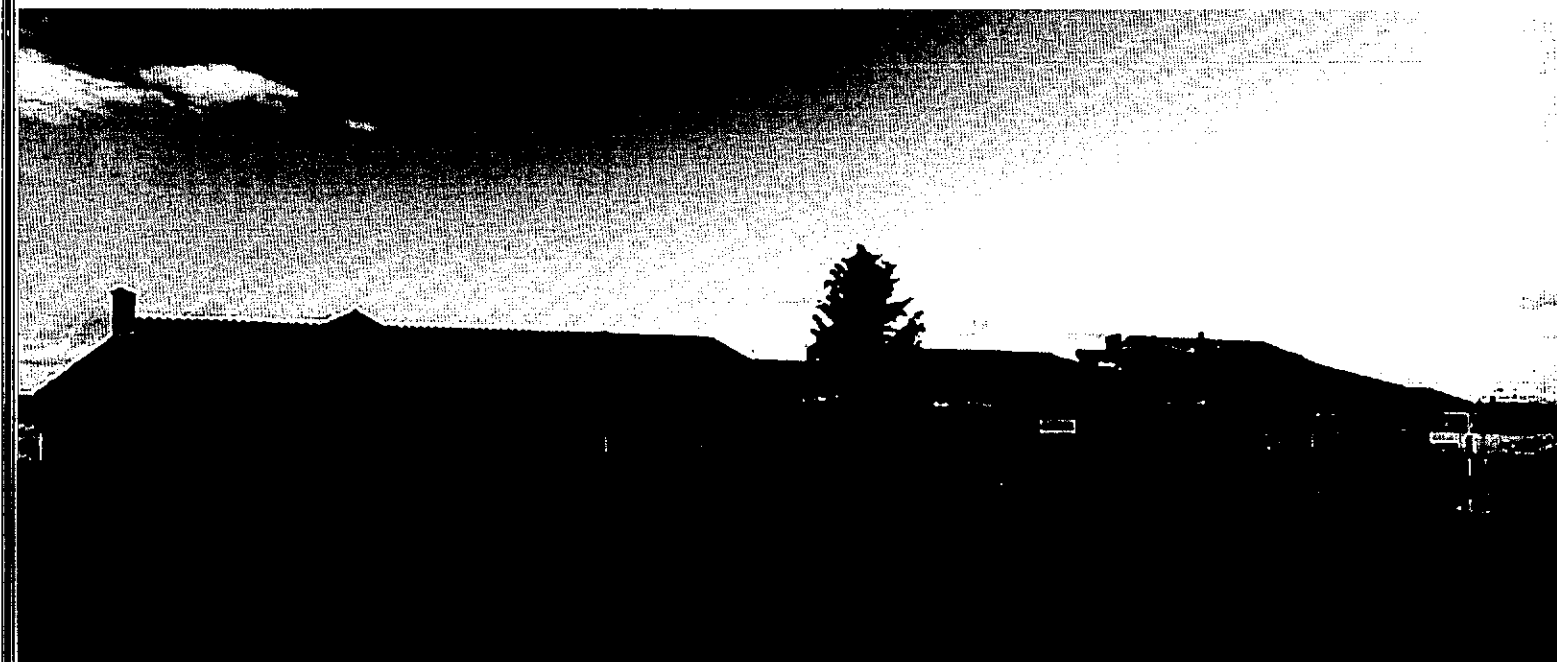
Escola EB I n.º 6 do Toural