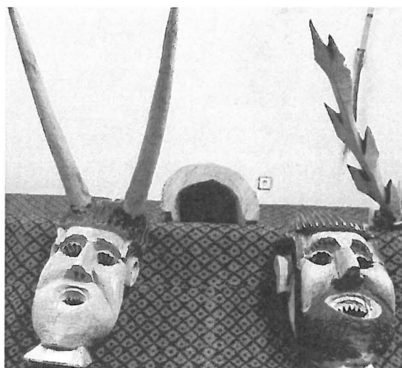
Figura n.º 2: Máscara de Ousilhão Foto: Aida Carvalho, 2007