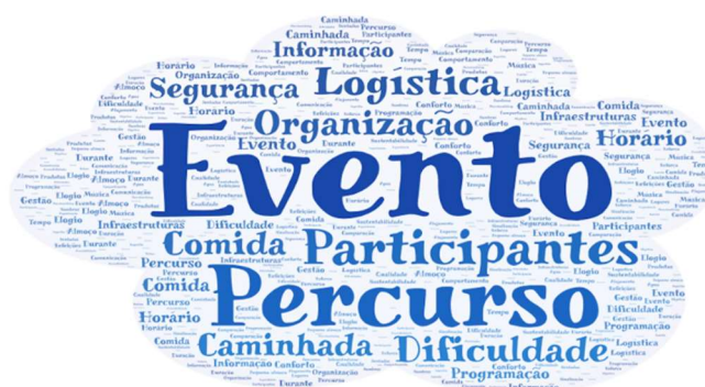
Figura 1 – Nuvem de palavras dos comentários/sugestões

A Figura 1 apresenta uma visão agregada das palavras-chave dos 115 comentários e sugestões dos participantes, evidenciando as temáticas predominantes. Destacam-se, entre as palavras-chave mais relevantes, os termos Evento (n=62), Percurso (n=39), Participantes (n=32), Logística (n=25), Dificuldade (n=23), Organização (n=23), Comida (n=22), Caminhada (n=21), Segurança (n=19), Horário (n=15), Informação (n=14) e Programação (n=10).