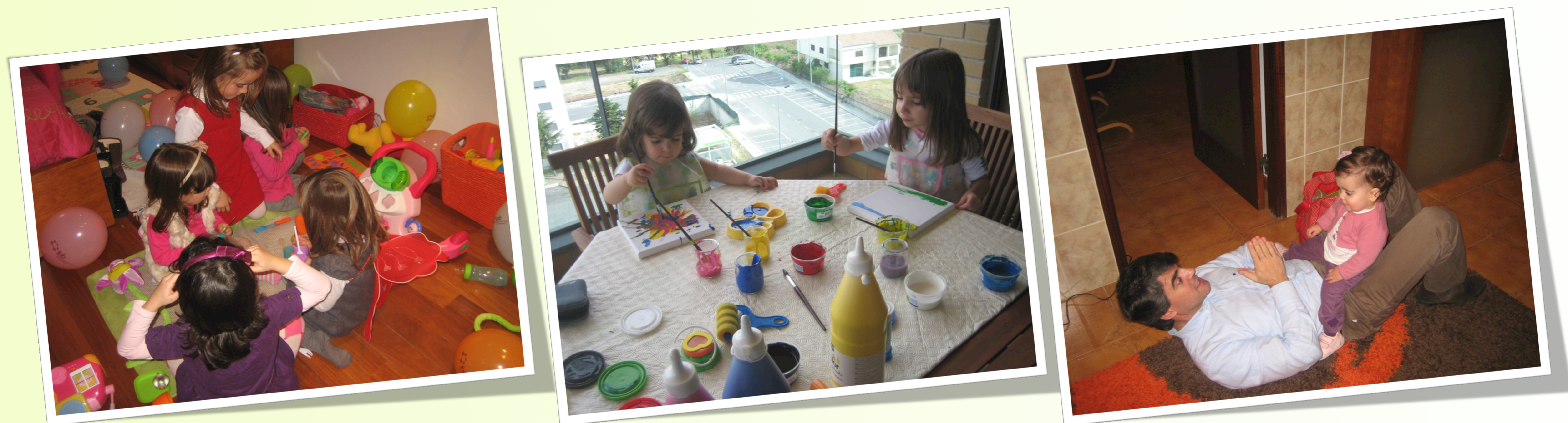
Figura 1 - Interações lúdicas