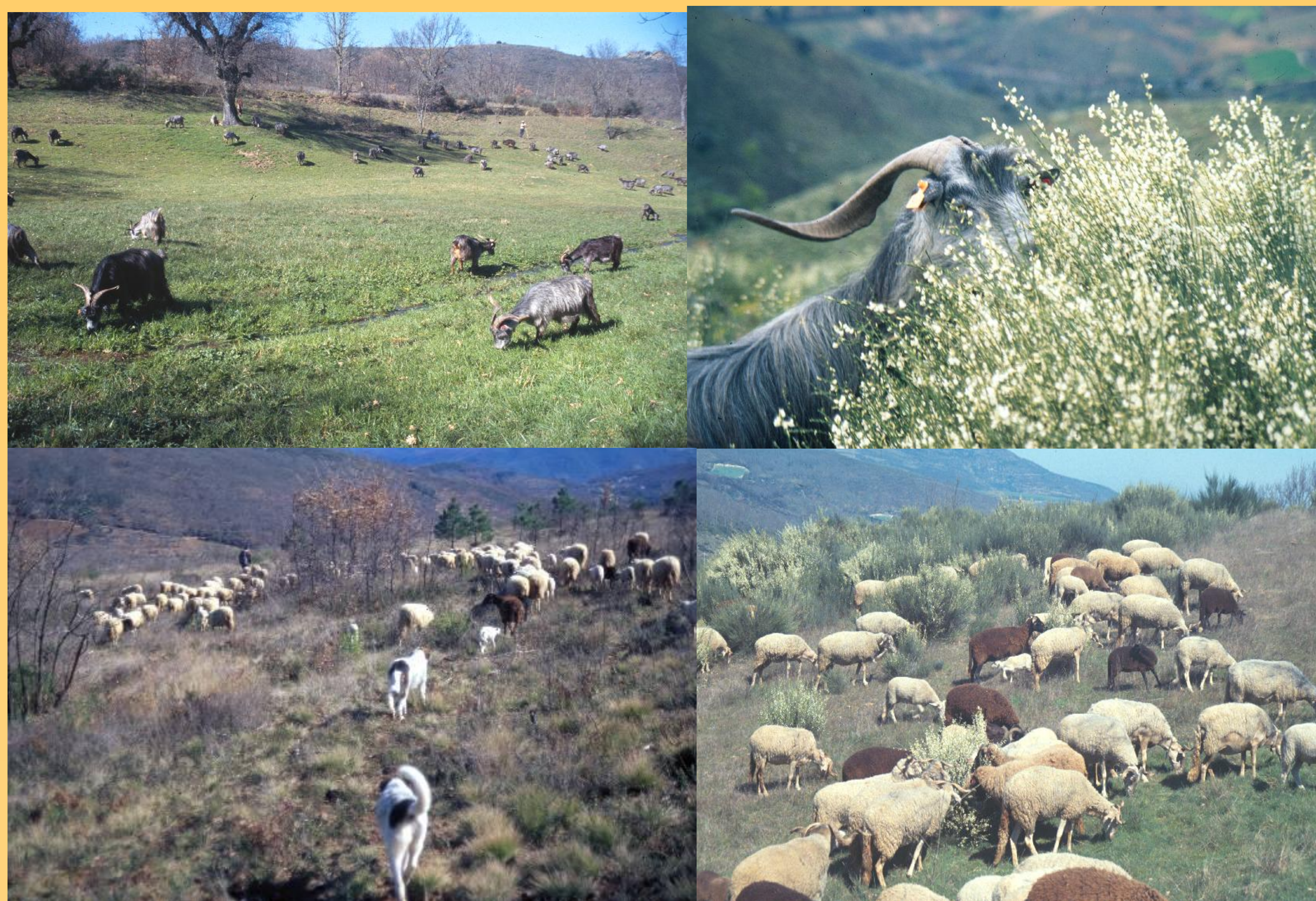
Figura 2: Pastoreio de diferentes recursos ao longo de um percurso de pastoreio.

A presença de árvores dispersas, a Transumância, o Pastoreio de percurso, a Construção de abrigos, o Consumo de espécies arbustivas, são exemplos de práticas pastoris que aumentam a complexidade da paisagem na região mediterrânica.