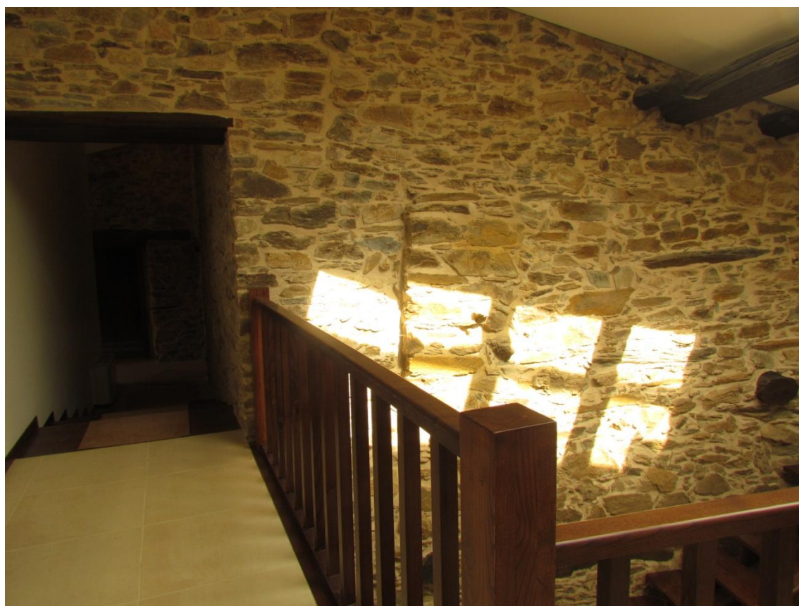
Figura 3-Foto Casa das Quintanas (Corane)

Esta candidatura assenta essencialmente na animação associada à existência de animais de raça Asinina “O Burro Mirandês” espécie em vias de extinção. O promotor sendo secretário técnico da Associação para o estudo e Proteção do Gado Asinino (AEPGA), possui uma exploração agrícola com efetivos desta raça e desenvolve atividades diferentes com estes animais, o caso da asinoterapia, uma experiência terapêutica para crianças com deficiência poderem ter contato com estes animais. Segundo o promotor são experiências bastante enriquecedoras. Com o investimento no Agroturismo está a conseguir maior dinamização da exploração, um acréscimo nos rendimentos familiares,