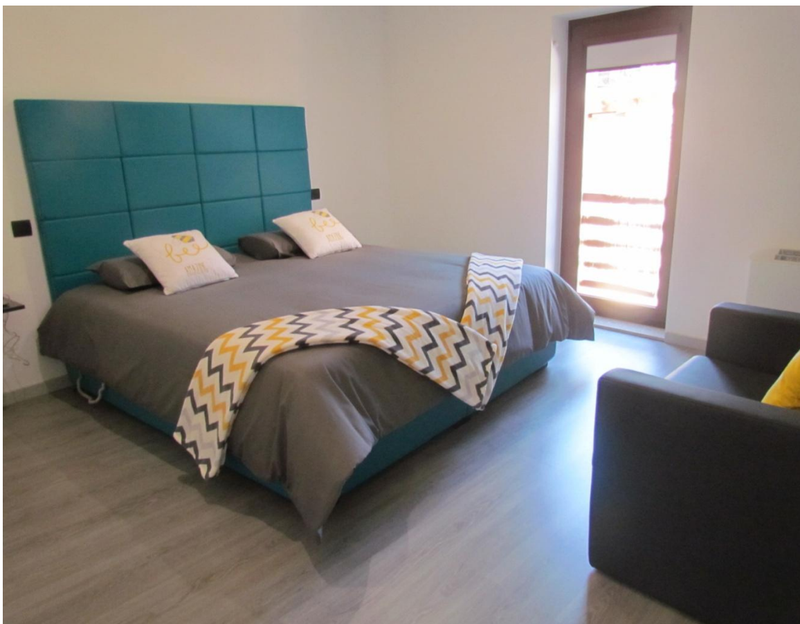
Figura 7-Foto = Habitat (Corane)

Este projeto que tem como principal característica ser um projeto de (turismo rural inclusivo), na casa TER “=Habitat”. Todos os quartos são acessíveis a pessoas com