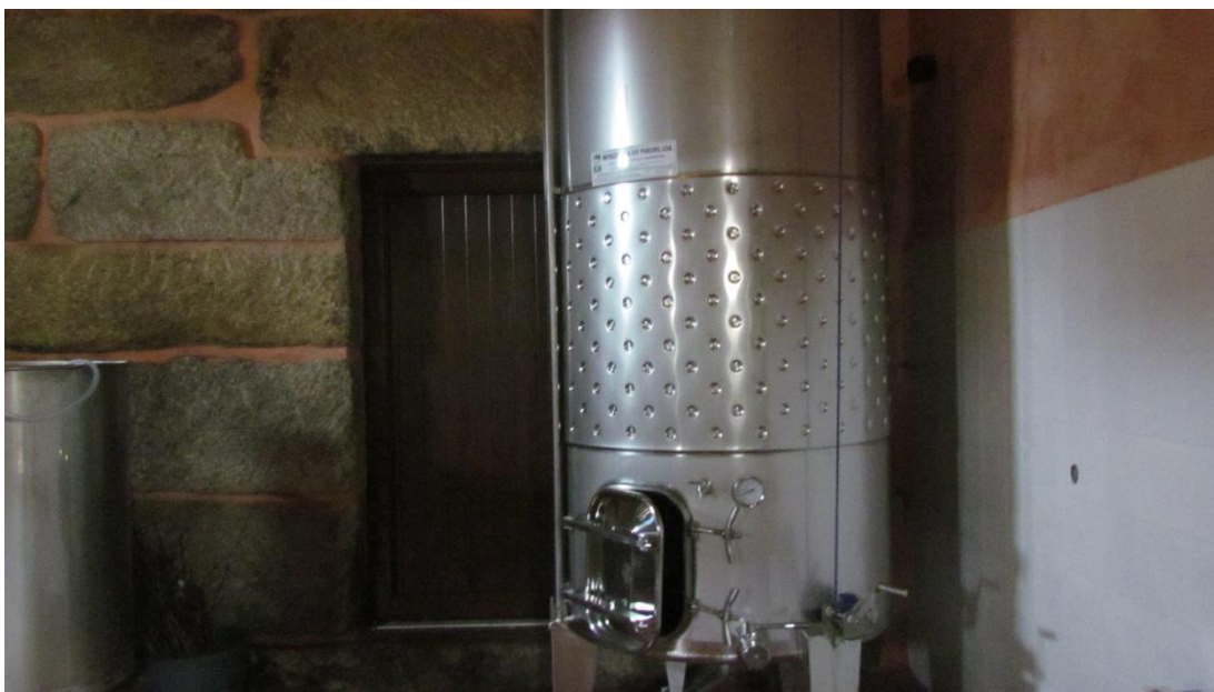
Figura 6-Foto Linha de Engarrafamento de Vinhos (Corane)