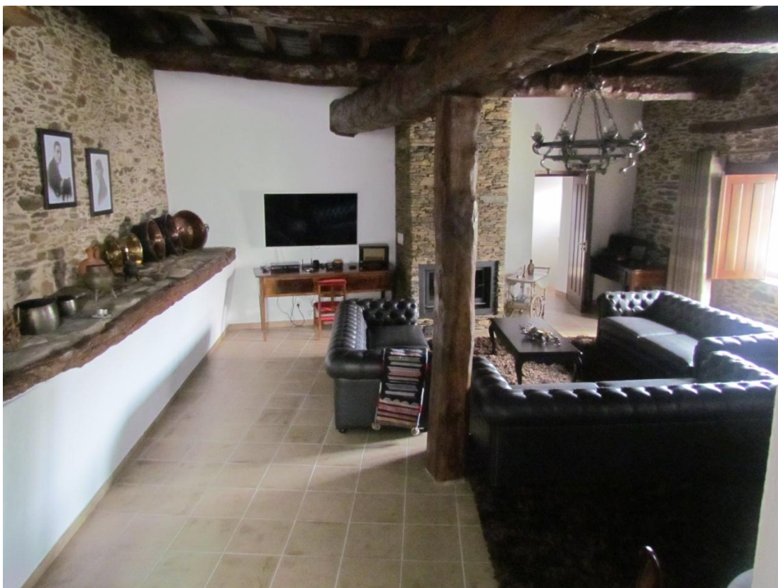
Figura 8-Foto Casa do Médico (Corane)

Destacamos ainda um outro projeto apoiado nesta ação; a “Casa do Médico”. Trata-se da recuperação e adaptação ao TER de uma casa na aldeia em Carção, concelho de Vimioso, construída pelo primeiro médico do concelho. Este pedido de apoio é promovido pelo bisneto do referido médico. Esta unidade conta com seis quartos e o espólio de médico encontra-se exposto numa sala denominada de consultório. Este pedido de apoio apresenta um investimento total elegível de 169 386,71 € com uma taxa de comparticipação de 50%, correspondendo a um subsídio não reembolsável de 84 693,36 €. No que diz respeito à criação de emprego, existe a obrigatoriedade por parte do promotor de criar um posto de trabalho, tendo já contratado uma colaboradora de serviços gerais. Este pedido de apoio, previa em sede de candidatura uma taxa de