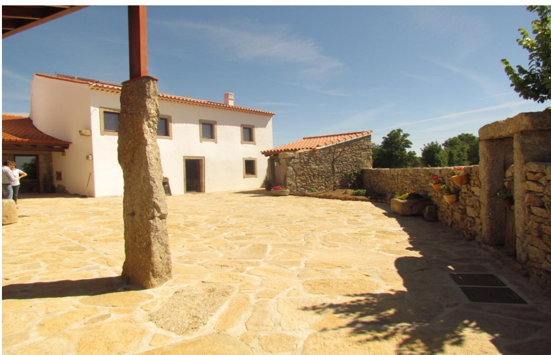
Figura 4- Foto Casa Puial Del Douro (Corane)

O projeto “Casa Puial Del Douro”, localiza-se na Aldeia Nova, no Concelho de Miranda do Douro. Este projeto tal como o anterior é pertinente pela componente de animação turística associada. O promotor, professor de Mirandês utiliza a sua experiência profissional e formativa para a realização de workshops e conferências temáticas em Mirandês, bem como passeios pedestres ambientais com identificação da fauna e da flora. Este agricultor e professor como atividade de trabalho, complementou a sua exploração agrícola, criando condições para receber turistas e utilizando uma experiência de vida como atividade animadora dos hóspedes. Esta candidatura apresenta um investimento total de 235 585,86€ com uma taxa de financiamento de 55%