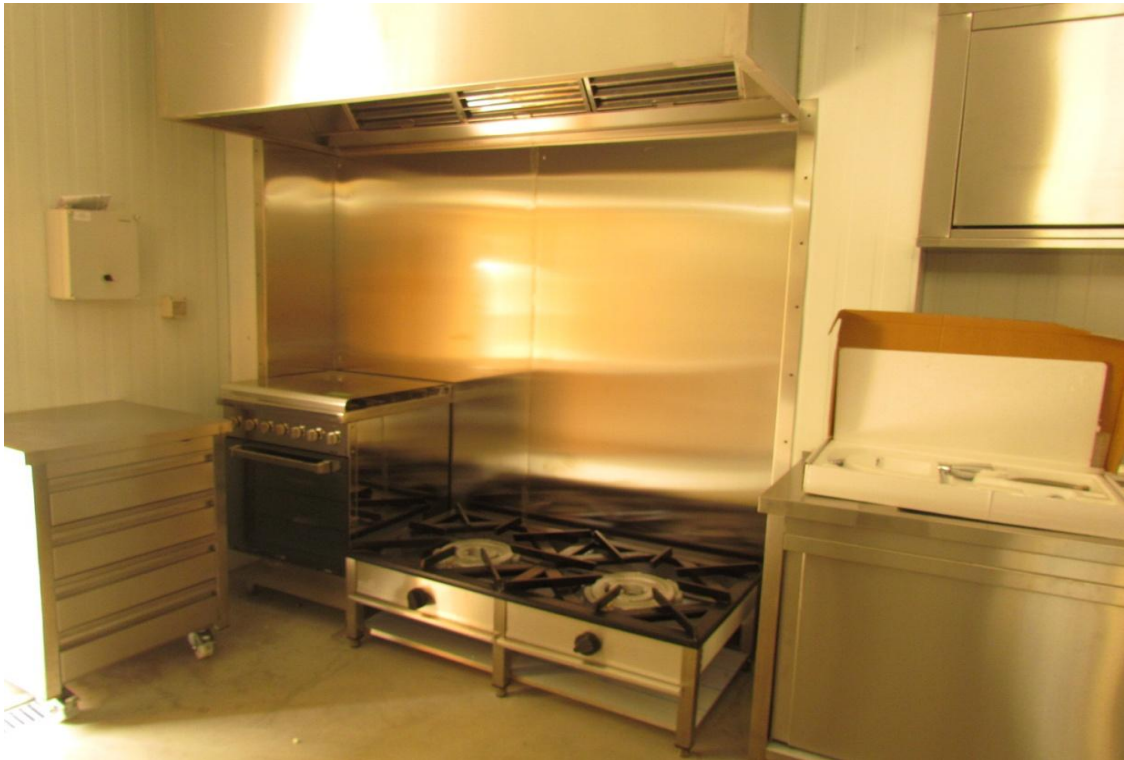
Figura 5-Foto Fumeiro de Parada (Corane)

O Projeto “Fumeiro de Parada”, trata-se de uma cozinha regional ou seja uma unidade de produção de fumeiro regional. Localiza-se na aldeia de Parada no concelho de Bragança, e é promovido por um jovem empresário em nome individual. Além deste investimento está ainda instalado como jovem empresário agrícola o que lhe permite conciliar e complementar as duas atividades. Com esta candidatura o promotor criou e valorizou uma cadeia de valor para os seus produtos que vai desde a criação de suínos até a venda de fumeiro, apostando assim nesta fileira de atividade, desde a criação da matéria-prima, à transformação e comercialização do produto final. Esta candidatura