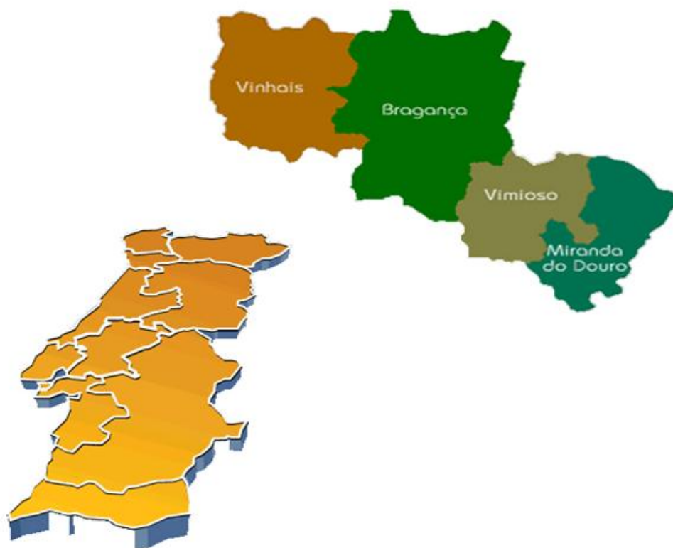
Figura 1-Mapa da Terra Fria Transmontana (Corane)

A Terra Fria Transmontana (TFT), constituída pelos concelhos de Bragança, Miranda do Douro, Vimioso e Vinhais, correspondente à área de atuação da Corane,