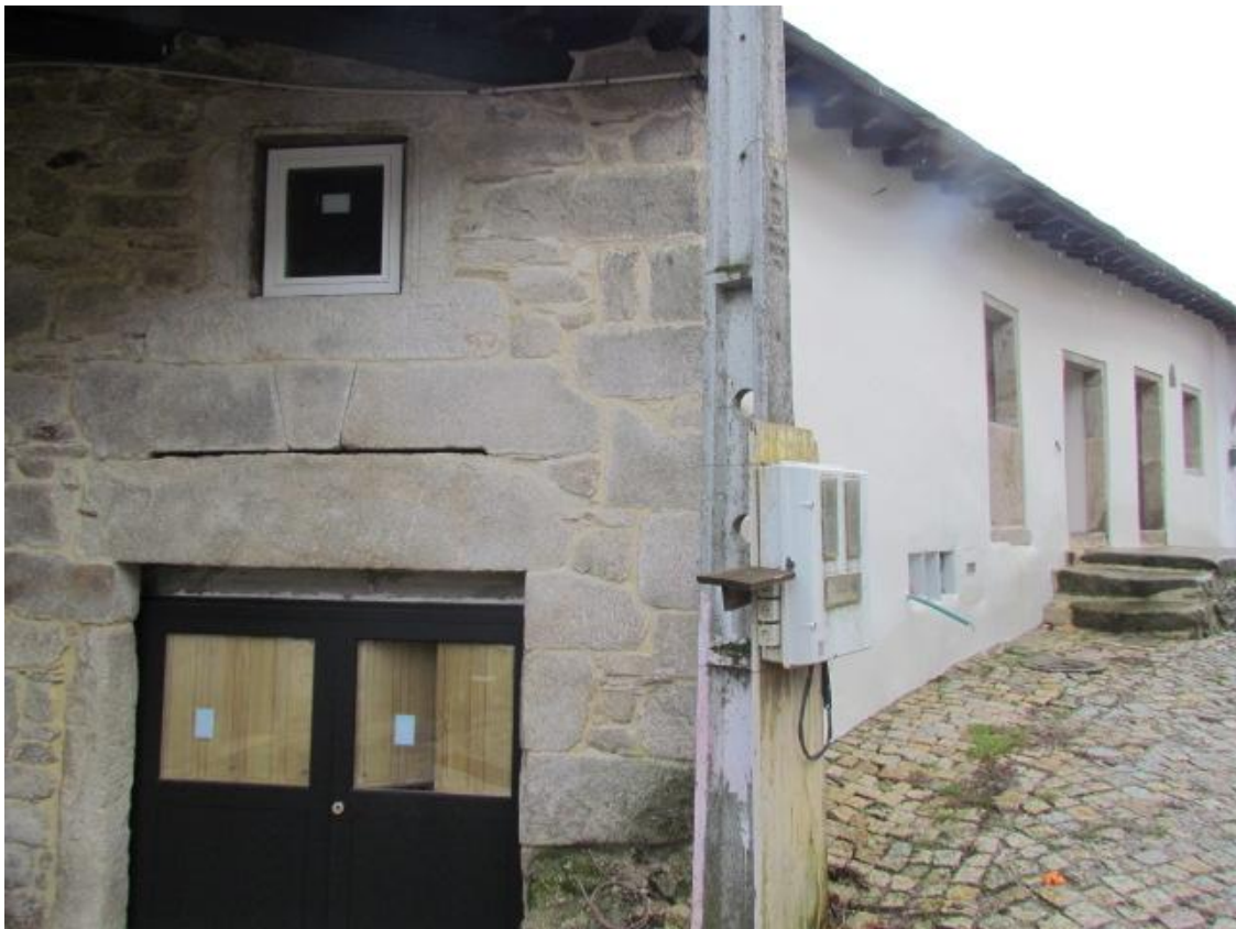
Figura 9- Foto Abrigo IV (Corane)

Destacamos ainda o projeto “Abrigo IV”. Trata-se de uma estrutura com quatro quartos, localizada na aldeia de Montesinho, concelho de Bragança. Segundo o livro do tomo do Mosteiro de San Martim de Sanábria em Espanha, a casa foi construída pelos Monges do Mosteiro gótico, situado nas montanhas de Sanábria e cujos terrenos chegavam até a cidade de Bragança. Esta casa era usada como um cenobium de meditação e abrigo de Monges que vinham pregar a fé e cobrar as rendas. O promotor que tem uma empresa de restauro e é licenciado em história da arte conservação e bens culturais, adquiriu o imóvel para o transformar numa unidade TER. Dinamiza atividades