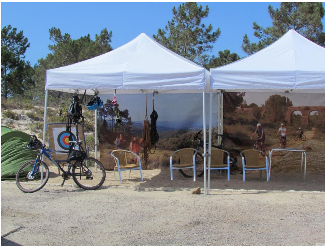
Figura 10-Foto Coordenadas de Turismo ativo (Corane)

Este pedido de apoio designado “Coordenadas de Turismo Ativo” promovido pela empresa Coordenada D`aventura, Unipessoal, Lda, criada para o efeito. O Projeto apresentado prevê a criação e desenvolvimento de uma empresa de animação turística. Da operação consta a criação de dezassete produtos turísticos e a aquisição dos respetivos equipamentos, tais como: Passeios pedestres (Expedição fotográfica, Birdwatching e Fauna e Flora), BTT, Canoagem, Manobras de cordas (Escalada, Rappel e Slide, Paralelas e Tirolesa), Tiro (Arco, Besta, Zarabatana e Fisga), Buggie (dois para adultos e um para jovens), Pontes, Paintball, Paramotor, Go cart, Organização TT,