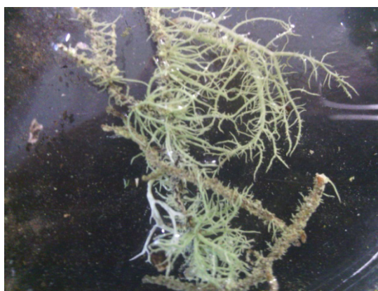
Figura 4- Usnea recolhida no local C

Após consultar a tabela incluída em Nunes (2011) chegámos à concentração de \text{SO}_2 , provável dos três locais como se mostra na tabela 1.