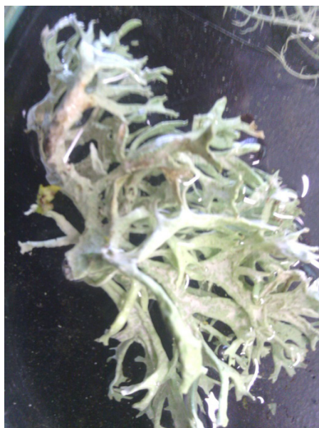
Figura 3 – Ramalina recolhida no local B