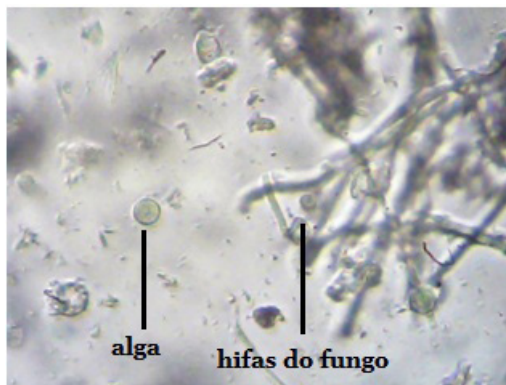
Figura 1- Fotografia da observação microscópica de um líquen (ampliação total 400x)

“...existe um fungo, também denominado micobionte, a que se juntam um ou mais indivíduos fotossintéticos, chamados ficobiontes, como as algas verdes (que estão presentes em cerca de 85 por cento das espécies de líquenes) e as cianobactérias (que surgem em aproximadamente 10% dos líquenes). Os restantes 5% resultam da presença simultânea de dois tipos de ficobiontes (Protistas e Moneras)...” (2011, s. p.).