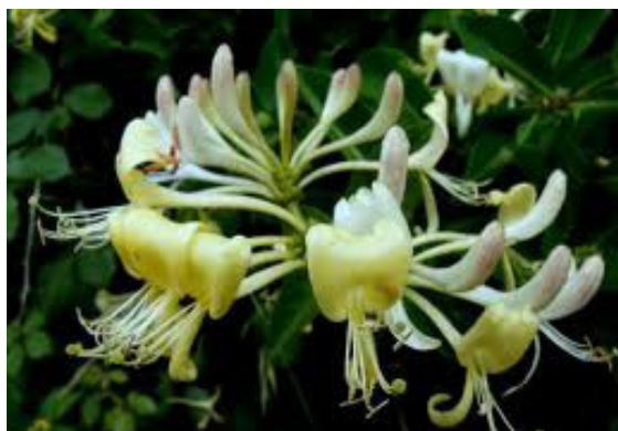
Figura 4 – Madressilva das Boticas

A madressilva das Boticas é também uma planta bastante popular na região transmontana, possuindo vastíssimas aplicações terapêuticas – garganta, boca, asma, tosse, parto, fígado e rins.