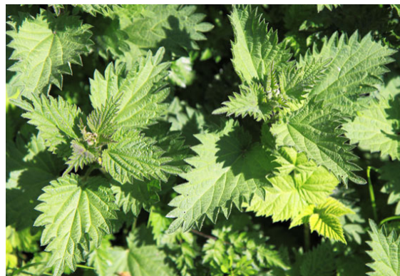
Figura 2 – Escrofulariáceas, plantas medicinais transmontanas