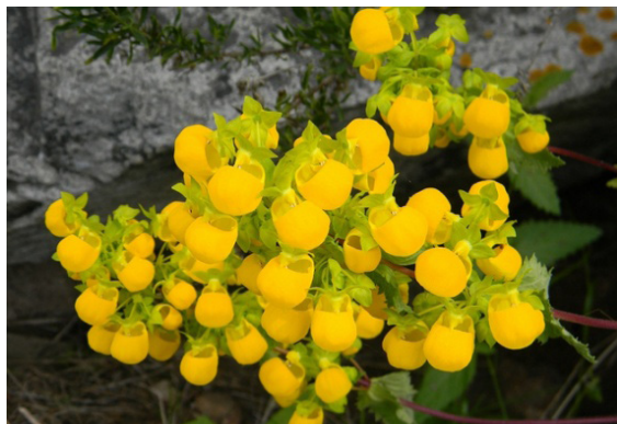
Figura 3 – Urticáceas, plantas medicinais transmontanas

balsâmico. As umbelíferas consideram-se ótimos digestivos que revigoram as funções estomacais. As escrofulariáceas aplicam-se, sobretudo, em queimaduras e feridas e, finalmente, as urticáceas utilizam-se em problemas de reumatismo e circulação sanguínea, colesterol e diabetes (Carvalho 2007).