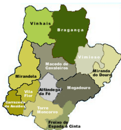
Figura 1 – Nordeste Transmontano

Entrevistas semi-estruturadas feitas a homens e mulheres, escolhidos aleatoriamente das zonas rurais de Trás-os-Montes, divulgaram que 94% dos inquiridos colhem e cultivam plantas medicinais; 75% apoderam-se das folhas e das flores das plantas com intuíto curativos e 66% assimilam conhecimentos medicinais alternativos através de pessoas com idades mais avançadas, amigos, vizinhos e meios de comunicação.